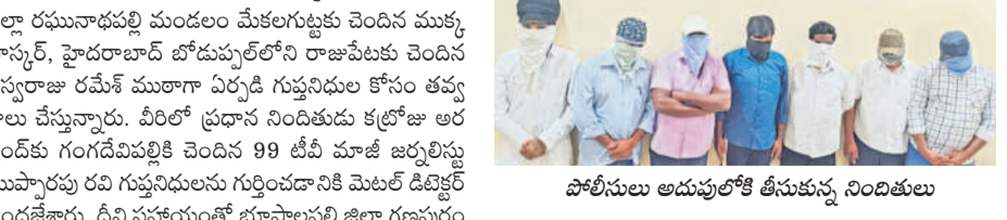
పోలీసులు అదుపులోకి తెచ్చిన నిధులు