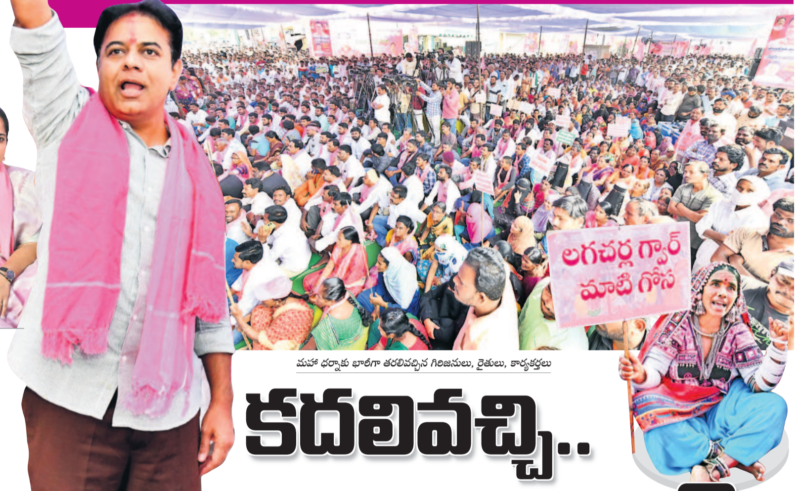
మహా ధర్మాకు భారతీగా తరలివచ్చిన గిరిజనులు, రైతులు, కార్మికులు

"కాంగ్రెస్లో రాజ్యం పెట్టేలో వెళ్లి తగలపెడతామంటే భయపడతాం అనుకున్నారా? ఇది కేసీఆర్ తయారుచేసిన బృందం.. కేసీఆర్ దళం.. ఎవరికీ భయపడం. మానుకోట రాజ్య మహాత్మ్యమేమిటో 'తెలంగాణ'ను అడ్డుకున్న ప్రతి ఒక్కడికీ తెలుసు. మానుకోటలో 14 ఏళ్ల కిందనే నివృత్తి పుట్టింది. తర్వాత తెలంగాణ వచ్చింది. మీరు వల్లనే ఇప్పుడు మంటల కొట్టుకుపోయి తెచ్చుకున్నం. వెయ్యి మందితో ధర్మా అనుకుంటే 25వేల మంది తరలివచ్చారు. రేవంత్ సర్కారుపై ప్రజల్లో ఎంత కోపమున్నదో, ఎంత వ్యతిరేకత ఉన్నదో ఈ మహాధర్మా చూస్తుంటే తెలుస్తున్నది. తెలంగాణలో ఏ గిరిజన ఆదర్శకుల అన్యాయం జరిగినా రాష్ట్రం మొత్తం కదలాల్సి.. కడంత్కొక్కాల్, దీనిని సద్దంగా ఉండాలి" అంటూ మానుకోట మహాధర్మా వేదిక నుంచి బీఆర్ఎస్ వర్కింగ్ పైసెడింట్ కేటీఆర్ పిలుపునిచ్చారు.