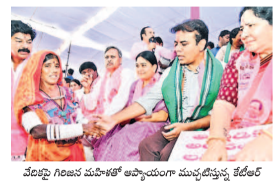
వేదికపై గిరిజన మహిళాతో ఆప్యాయంగా ముచ్చటీస్తున్న కేటీఆర్

- మహబూబాబాద్, నవంబర్ 25 (నమస్తే తెలంగాణ)/మహబూబాబాద్ రూరల్