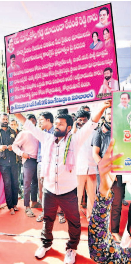
'ఇది మానుకోట గడ్డ యాదికండా.. రేవంత్ రెడ్డి' అనే ప్లెకేసిని ప్రదర్శిస్తున్న యువకుడు