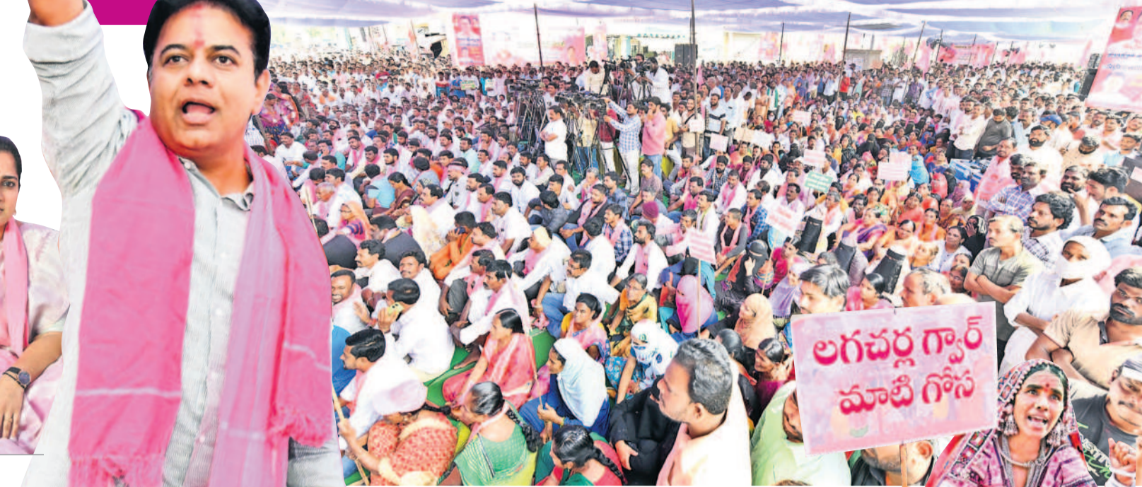
మహా ధర్మాకు భారతీగా తరలివచ్చిన గిరిజనులు, రైతులు, కార్మికులు

"కాంగ్రెస్ రాజ్యం, పెట్రోల్ వోని తగలపడతామంటే భయపడతాం అనుకున్నారా? ఇది కేసీఆర్ తయారుచేసిన బృందం.. కేసీఆర్ దళం.. ఎవరికీ భయపడం. మానుకోట రాజ్య మహాధర్మమేమిటో 'తెలంగాణ'ను అడ్డుకున్న ప్రతి ఒక్కడికీ తెలుసు. మానుకోటలో 14 ఏళ్ల కిందనే నివృత్తి పుట్టింది. తర్వాత తెలంగాణ వచ్చింది. మీరు వచ్చి ఇవ్వమంటే కొట్టుకుపోయి తెచ్చుకున్నం. వెయ్యి మందితో ధర్మా అనుకుంటే 25వేల మంది తరలివచ్చారు. రేవంత్ సర్కారుపై ప్రజల్లో ఎంత కోపమున్నదో, ఎంత వ్యతిరేకత ఉన్నదో ఈ మహాధర్మా చూస్తుంటే తెలుస్తున్నది. తెలంగాణలో ఏ గిరిజన ఆదర్శకుల అన్యాయం జరిగినా రాష్ట్రం మొత్తం కడదాలి. కడం తొక్కాలి. దీనిని స్పష్టంగా ఉండాలి" అంటూ మానుకోట మహాధర్మా వేదిక నుంచి బీఆర్ఎస్ వర్కింగ్ సైనికంలో కేటీఆర్ పిలుపునిచ్చారు.