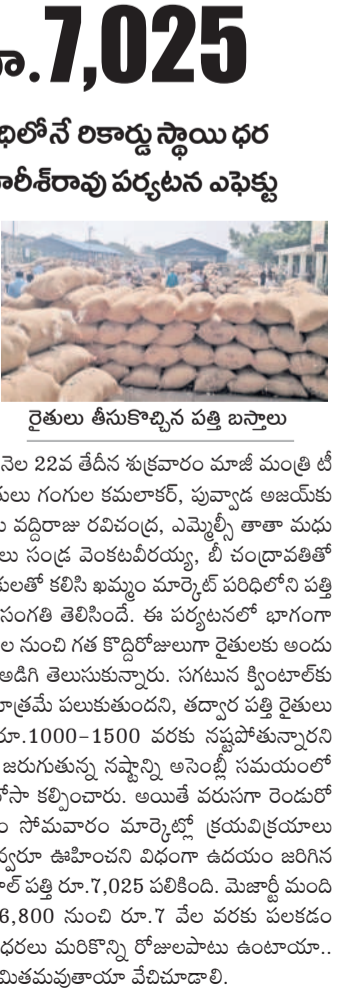
రైతులు తీసుకొచ్చిన పత్తి బస్తాలు