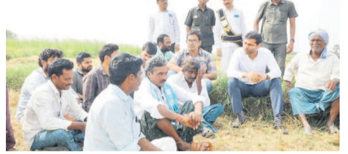
రైతులతో మాట్లాడుతున్న కలెక్టర్ ముజిమ్లత్ ఖాన్

రైతులతో ముఖాముఖీలో కలెక్టర్ ముజిమ్లత్ ఖాన్