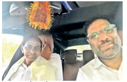
మాజీ సీఎం కేసీఆర్ కారు డ్రైవింగ్ చేస్తుండగా పక్కనే కూర్చున్న ఎంపీ వద్దరాజు

వర్కింగ్ ప్రెసిడెంట్ కేసీఆర్తో కలిసి మహబూబాబాద్లో జరిగిన మహా ధర్నా కార్యక్రమాలకు హాజరైన ఎంపీ వద్దరాజు సాయంత్రానికి కేసీఆర్ను కలిసేందుకు ఫాంహార్కు వెళ్లారు. ఈ సందర్భంగా కేసీఆర్ ఎంపీ వద్దరాజును తన కారులో పక్కనే కూర్చోబెట్టుకుని వ్యవహారాల క్షేత్రంలోని వివిధ పంటలను పరిశీలించేస్తూ తన సాగు చేస్తున్న పంటల వివరాలను వివ