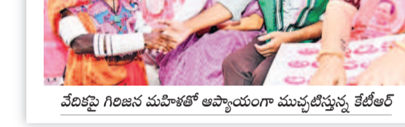
వేదికపై గిరిజన మహిళాతో ఆప్యాయంగా ముచ్చటీస్తున్న కేటీఆర్