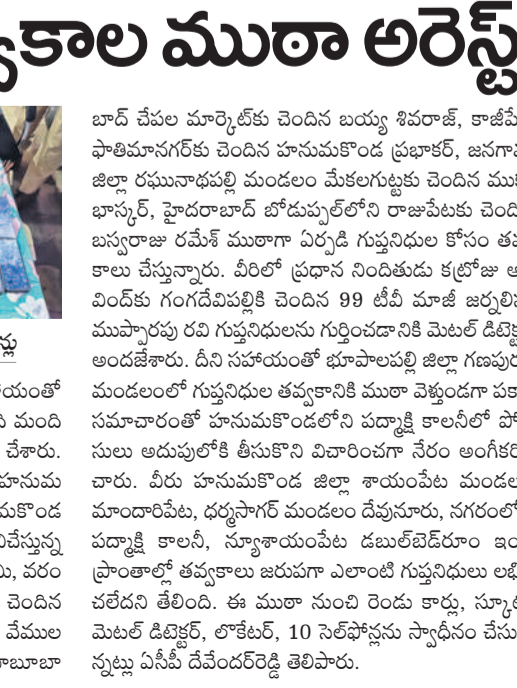
పోలీసులు అదుపులోకి తెసుకున్న నిందితులు