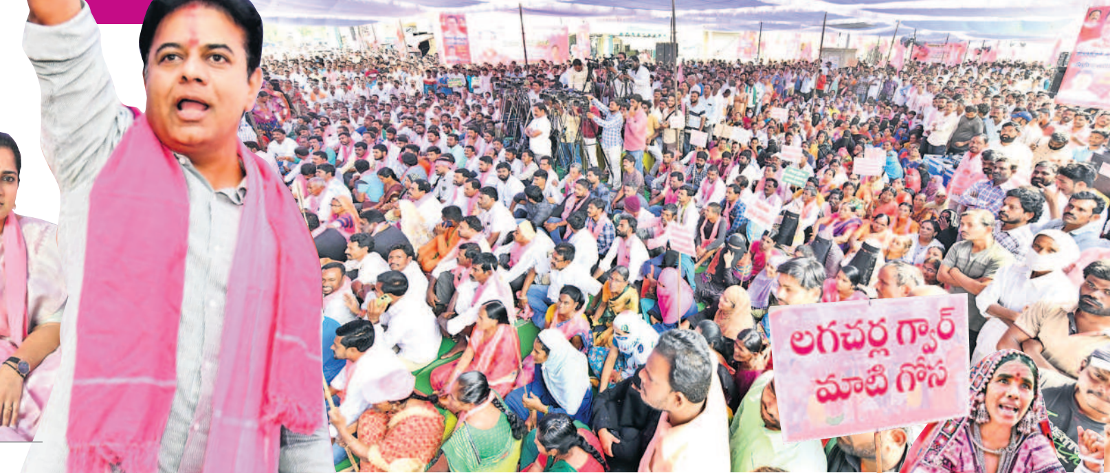
మహా ధర్మాకు భారతీగా తరలివచ్చిన గిరిజనులు, రైతులు, కార్మికులు