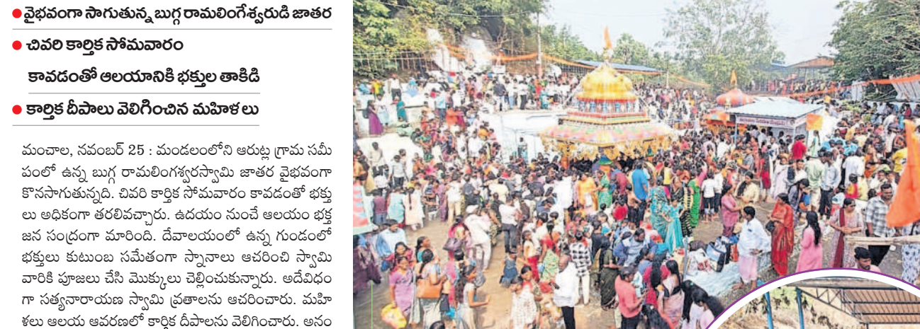
జన సందోహంగా మాలిన బుగ్గ రామలింగేశ్వర స్వామి ఆలయ ప్రాంగణం సత్సవాలను ప్రజలు ఆనందించిన భక్తులు