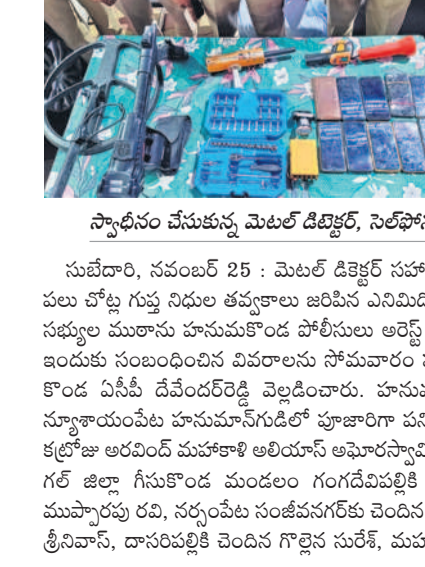
స్పాగ్నెం చేసుకున్న మెటల్ డిటెక్టర్, సిల్వర్ ఫస్టన్