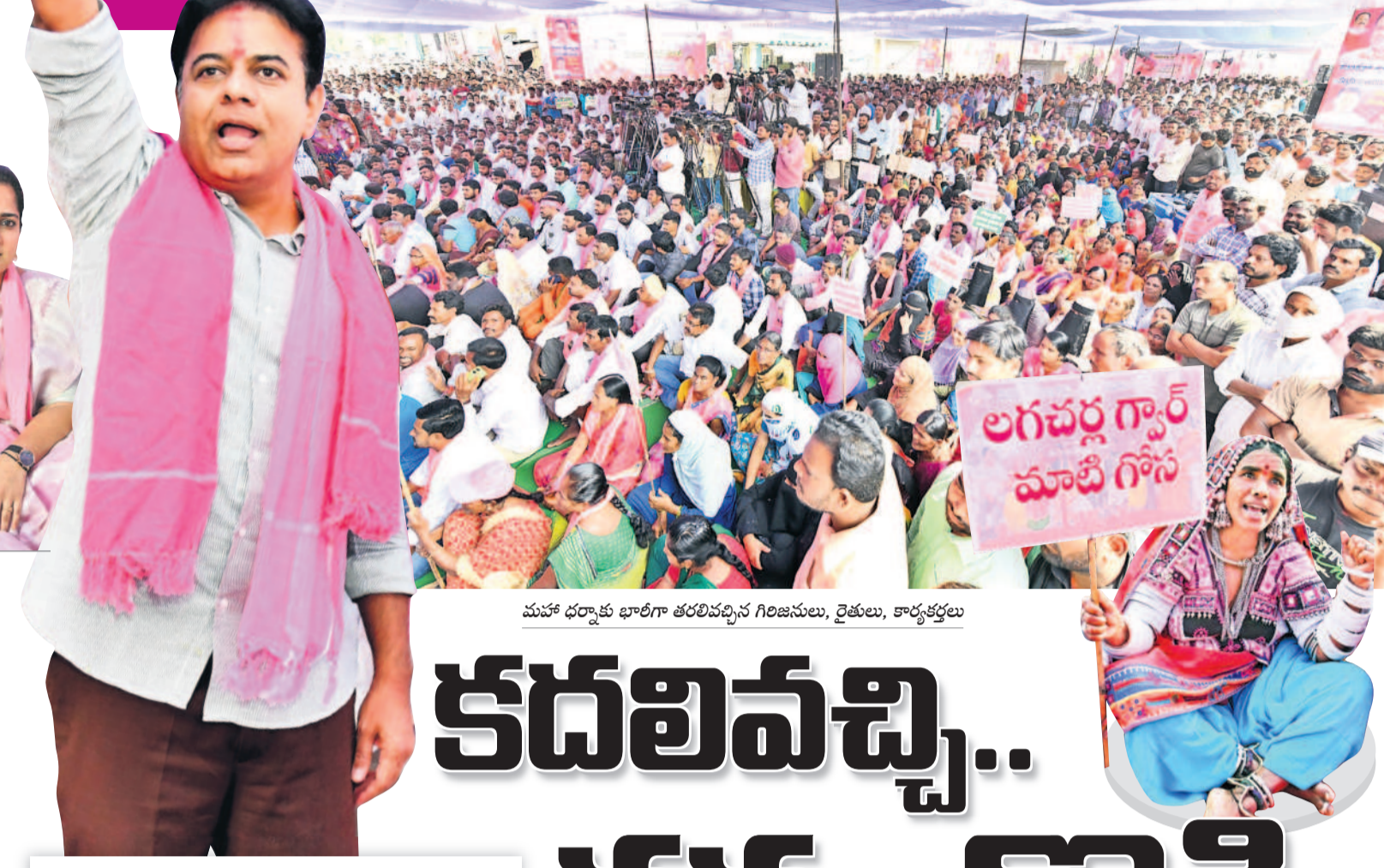
మహా ధర్మాకు భారతీగా తరలివచ్చిన గిరిజనులు, రైతులు, కార్మికులు

రైతులను హింసిస్తున్న రేపంత్ సీఎం రేపంత్ రెడ్డి లగచర్ల గిరిజన రైతులను హింసిస్తున్నాడు. కొడంగల్ నియోజకవర్గంలో అతడి అనుచరులతో కలిసి అనేక దుర్మార్గుత్వ పనులు చేస్తున్నాడు. గిరిజనులు ఐక్యంగా ఉండి ప్రభుత్వానికి బుద్ధి చెప్పాలి. ప్రతి ఒక్కరూ స్వచ్ఛందంగా లగచర్ల రైతులకు మద్దతుగా ఉండాలి. మహారాష్ట్ర ఎన్నికల ప్రచారంలో పాల్గొన్న రేపంత్ రెడ్డి దుమ్ములో కొట్టుకుపోయాడు. కాంగ్రెస్ సర్కారుకు బుద్ధి వచ్చేలా ప్రతి ఒక్కరూ కలిసి రావాలి. - మాజీ కవి, మాజీ ఎంపీ, బీఆర్ఎస్ మహబూబాబాద్ జిల్లా అధ్యక్షురాలు