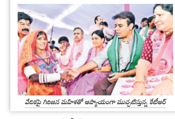
వేదికపై గిరిజన మహిళాతో ఆప్యాయంగా ముచ్చటపెట్టిన కేటీఆర్