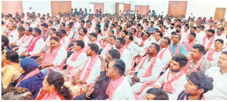
మంగళవారం రాజన్న సిరిసిల్ల జిల్లా కేంద్రంలోని పార్టీ కార్యాలయంలో నిర్వహించిన దీక్షా దినవన సన్మాహాళ సమావేశంలో పాల్గొన్న బీఆర్ఎస్ నాయకులు, కార్యకర్తలు