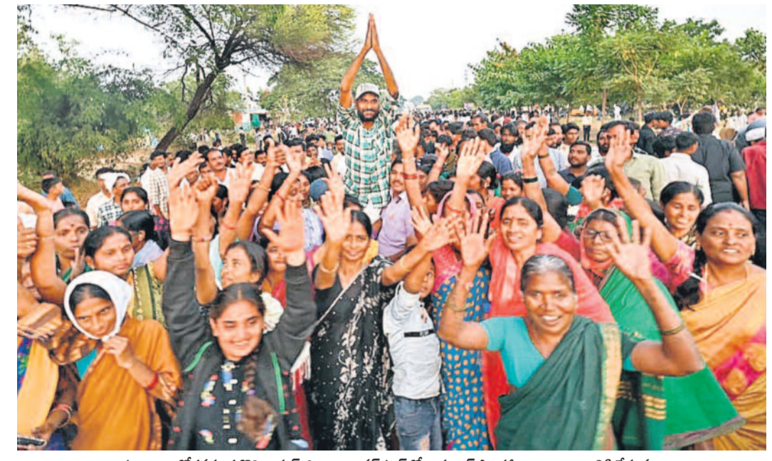
ప్రజల ఆందోళనకు తలోగ్గి నిర్దోల జిల్లా బిలావర్ పూర్ లో ఇదనాల్ ఫ్యాక్టరీ నిర్మాణాన్ని నిలిపివేస్తున్నట్లు ప్రభుత్వం ప్రకటించడంతో రోడ్లపైకి వచ్చి సంఘాలు చేసుకుంటున్న గ్రామస్థాయి

PUBLISHED FROM KARIMNAGAR • HYDERABAD • WARANGAL • KHAMMAM • NALGONDA • MAHABUBNAGAR • NIZAMABAD www.ntnews.com 00/ntdailyonline