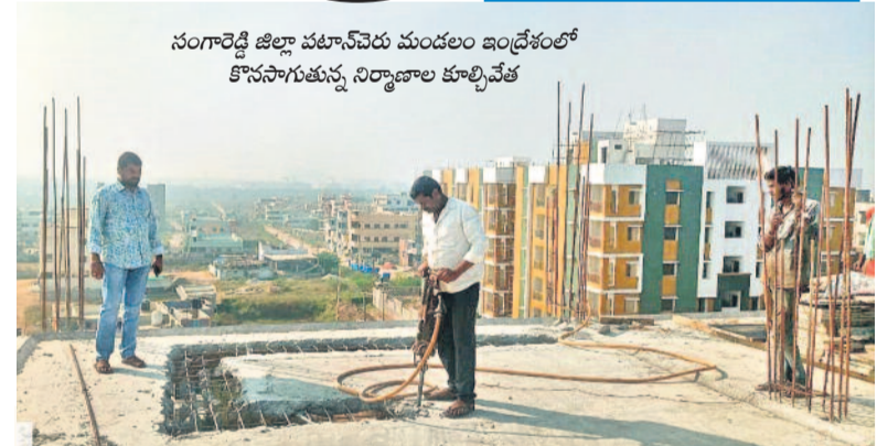
సంగారెడ్డి జిల్లా పటాన్ చెరు మండలం ఇండ్రోలో కొనసాగుతున్న నిర్మాణాల కూల్చివేత

జిల్లాల్లోనూ బుల్డోజర్! అగస్టు 28 మహబూబ్ నగర్ లోని ఆదర్శనగర్ లో అధికారులు అధికారులు నేలమట్టం చేశారు. ఇవన్నీ దివ్యాంగులవే. సెప్టెంబర్ 5 పెద్దపల్లి జిల్లా రామగుండంలో మూడు ఫంక్షనరీలకు ఛోటిపిలు. అందులో జి.ఎస్.ఎస్.కె.కె. కార్పొరేట్ లిమిటెడ్ రాజ్ కేసు చెందిన సెరి ఫంక్షనరీలను కూల్చివేసిన అధికారులు. సెప్టెంబర్ 27 అదిలాబాద్ పట్టణంలోని ఖానాపూర్ చెరువు ఎఫ్ టీఎల్ పరిధిలోని ఇండ్ల కొలతలు వేస్తున్న రెవెన్యూ, మున్సిపల్, ఇతర పబ్లిక్ అధికారులను స్థానికులు అడ్డుకున్నారు. తీవ్రనిరసన తో అధికారులు బృందం వెనుదిరిగింది. అక్టోబర్ 5 అదిలాబాద్ జిల్లా ఇండ్రోవైల్ లోని మార్కెట్ యార్డుకు అనుకుని ఉన్న రెండు ఇండ్లను అధికారులు కూల్చివేశారు. సెప్టెంబర్ 25 సూర్యాపేటలోని నల్లపు చెరువు ఎఫ్ టీఎల్ లోని ఇండ్లను రోడ్ల కోసం వచ్చిన అధికారులను స్థానికులు అడ్డుకున్నారు. పెద్ద ఎత్తున ఆందోళన చేశారు. సెప్టెంబర్ 20 మంచినల్ల జిల్లా నన్నూరులో తెలంగాణ బొగ్గుగని కార్పొరేషన్ సంస్థ మాజీ నేత ఇల్లు కూల్చివేత. నవంబర్ 4 పెద్దపల్లి జిల్లా గోదావరిలో జి.ఎస్.ఎస్.కె.కె. కార్పొరేషన్ అధికారులు బుల్డోజర్లతో కూల్చివేశారు.