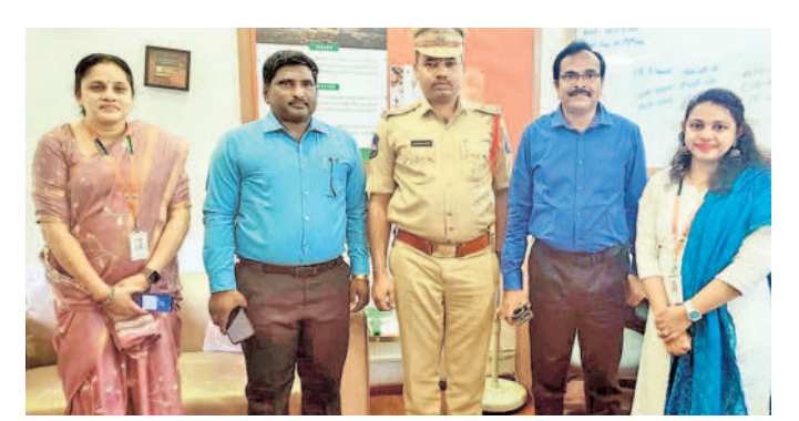
కార్యక్రమంలో పాల్గొన్న జీడిమెట్ల సీఐ మల్లేశ్