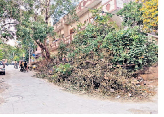
మార్లు అధికారులకు ఫిర్యాదు చేసినా పట్టింకోవడం లేదని స్థానికులు వాపోతున్నారు. ఇప్పటికైనా సంబంధిత అధికారులు స్పందించి రోడ్లపై పడిఉన్న చెట్ల కొమ్మలను తొలగంచాలని స్థానికులు కోరుతున్నారు.

యని చెట్ల కొమ్మలను తొలగించారు. నెలలు గడుస్తున్నా సిబ్బంది వాటిని తరలించలేదు. దీంతో పాదచారులు, వాహనదారుల రాకపోకలకు ఇబ్బదింగా మారింది. రోడ్లపై అడ్డుగా ఉన్న చెట్ల కొమ్మలను తొలగించాలని పలు