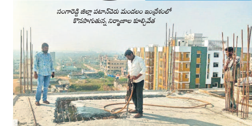
సంగారెడ్డి జిల్లా పటాన్చెరు మండలం ఇండ్రోలో కొనసాగుతున్న నిర్మాణాల కూల్చివేత

జిల్లాల్లోనూ బుల్డోజర్! అగస్టు 28 మహబూబ్ నగర్ లోని ఆదర్శనగర్ లో అర్బరాల్ 75 ఇండ్లను అధికారులు నేలమట్టం చేశారు. ఇవన్నీ దివ్యాంగులవే. సెప్టెంబర్ 5 పెద్దపల్లి జిల్లా రామగుండంలో మూడు ఫంక్షనరీలకు ఛోటిపిలు. అందులో జిఆర్ఎస్ నేత, కాల్వోల్టర్ వెంబల రాజేశ్వరి చెందిన సరి ఫంక్షనరీలను కూల్చివేసిన అధికారులు. సెప్టెంబర్ 27 అదిలాబాద్ పట్టణంలోని ఖానాపూర్ చెరువు ఎఫ్ టీఎల్ పరిధిలోని ఇండ్ల కొలతలు వేస్తున్న రెవెన్యూ, మున్సిపల్, ఇతర పబ్లిక్ అధికారులను స్థానికులు అడ్డుకున్నారు. తీవ్రనిరసన తో అధికారులు బృందం వెనుదిరిగింది. అక్టోబర్ 5 అదిలాబాద్ జిల్లా ఇండ్రోల్లోని మార్కెట్ యార్డుకు అనుకుని ఉన్న రెండు ఇండ్లను అధికారులు కూల్చివేశారు. సెప్టెంబర్ 25 సూర్యాపేటలోని నల్లచెరువు ఎఫ్ టీఎల్ లోని ఇండ్రోల్లోని కోసం పట్టణ అధికారులను స్థానికులు అడ్డుకున్నారు. పెద్ద ఎత్తున ఆందోళన చేశారు. సెప్టెంబర్ 20 మంచినల్ల జిల్లా నల్లపల్లిలో తెలంగాణ బొగ్గుగని కార్మికుల సంఘం మాజీ నేత ఇల్లు కూల్చివేత. నవంబర్ 4 పెద్దపల్లి జిల్లా గోదావరిలో జిఆర్ఎస్ కార్యాలయాన్ని అధికారులు బుల్డోజర్ తో కూల్చివేశారు.