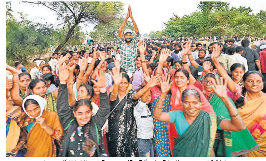
ప్రజల ఆందోళనకు తలోగ్గి నిర్దోల జిల్లా బిలావర్ పూర్ లో ఇదనాల్ ఫ్యాక్టరీ నిర్మాణాన్ని నిలిపివేస్తున్నట్లు ప్రభుత్వం ప్రకటించడంతో రోడ్లపైకి వచ్చి సంఘాలు చేసుకుంటున్న గ్రామస్థలు

గురువారం THURSDAY 28.11.2024 హైదరాబాద్ HYDERABAD పేజీలు: 14+4 Pages: 14+4 త్రయోదశి సూర్యోదయం: 6-28, సూర్యాస్తమయం: 5-39. శ్రీ క్రోధి నామ సంవత్సరం దక్షిణాయనం శరత్ రుతువు కార్తీక మాసం కృష్ణ పక్షం తిథి: త్రయోదశి పూర్ణి. సక్రంతం: చిత్త ఉదయం 7-35 వరకు, తదుపరి స్యాతి. వర్షం: పగలు 1-50 నుంచి పగలు 3-37 వరకు. రాహుకాలం: పగలు 1-27 నుంచి పగలు 2-51 వరకు. దుర్భుహార్యం: ఉదయం 10-12 నుంచి ఉదయం 10-57 వరకు, పునర్ దుర్భుహార్యం: పగలు 2-40 నుంచి పగలు 3-24 వరకు. అమృతకాలం: రాత్రి 12-30 నుంచి రాత్రి 2-17 వరకు. PUBLISHED FROM HYDERABAD • KARIMNAGAR • WARANGAL • KHAMMAM • NALGONDA • MAHABUBNAGAR • NIZAMABAD www.ntnews.com 00/ntdailyonline