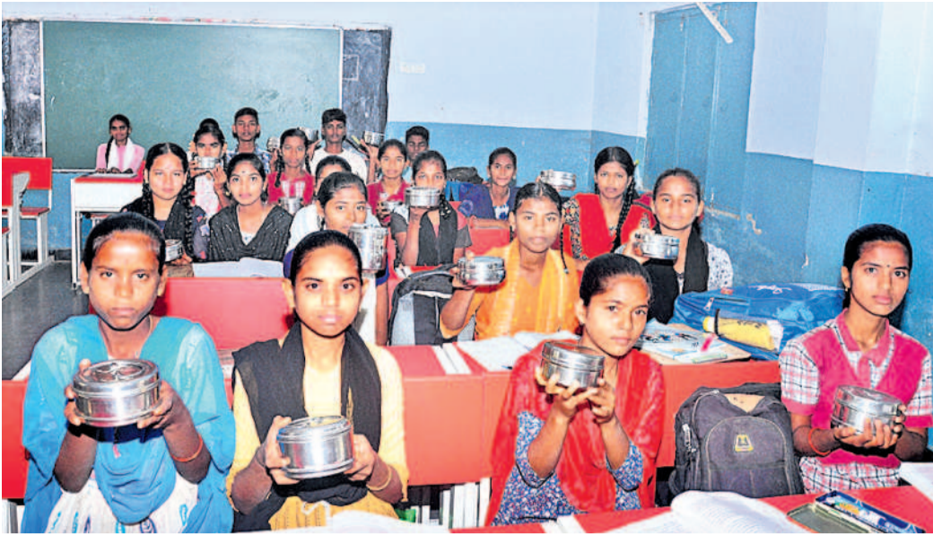
తమ ఇంట్ల నుంచి తెచ్చుకున్న లంచబాక్సులను చూపుతున్న మాగసూరు పాఠశాల విద్యార్థులు