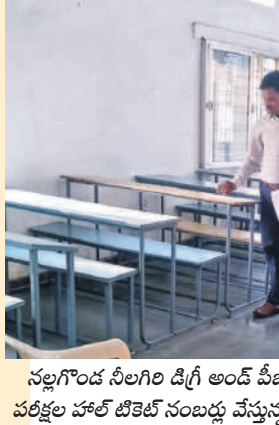
నల్లగొండ సీలగిరి డిగ్రీ అండ్ పీజీ కళాశాలలో పరీక్షల హాల్ టికెట్ సంబంధ వేస్తున్న అధ్యాపకుడు

రామగిరి, నవంబర్ 27 : మహాత్మాగాంధీ యూనివర్సిటీ పరిధిలో ఉమ్మడి జిల్లా వ్యాప్తంగా డిగ్రీ విద్యార్థులకు నిర్వహించాల్సిన పలు సెమిస్టర్ పరీక్షలు ఈ నెల 28నుంచి ప్రారంభం కానున్నాయి. షీజి రియంబర్డ్ మెంట్స్ విడుదల చేయాలని ప్రైవేట్ డిగ్రీ అండ్ పీజీ కళాశాలల యాజమాన్యాలు కళాశాల నిరవధిక బండ్ పాటించడంతో యూనివర్సిటీ పలు పరీక్షలను వాయిదా వేసిన విషయం విదితమే. ప్రభుత్వం యాజమాన్యాలు తో చర్చలు చేయడంతో విద్యార్థుల భవిష్యత్తు దృష్టిలో ఉంచుకుని పరీక్షల నిర్వహణకు ముందుకు వచ్చాయి. దాంతో పర్సనల్ పరీక్షల విభాగం ఆధ్వర్యంలో పరీక్షలకు సిద్ధం చేశారు. నవంబర్లో జరుగాల్సిన పలు పరీక్షలను వాయిదా వేసి డిసెంబర్లో నిర్వహిస్తున్నట్లు ఇప్పటికే యూనివర్సిటీ పరీక్ష విభాగం వెల్లడించింది. 1వ సెమిస్టర్ పరీక్షలు మధ్యాహ్నం 2 నుంచి సాయంత్రం 5 గంటల వరకు, 3వ సెమిస్టర్ పరీక్షలు ఉదయం 10 నుంచి మధ్యాహ్నం 1 గంటల వరకు, 5వ సెమిస్టర్ మధ్యాహ్నం 2 నుంచి సాయంత్రం 5 గంటల వరకు జరుగుతున్నాయి. మారిన పరీక్షల కాలనిర్ణయం పట్టికను పర్సనల్ వెబ్సైట్లో