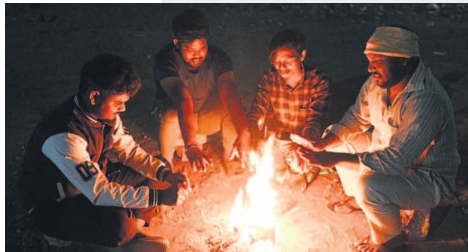
నల్లగొండలో చలి మంట వేసుకున్న యువకులు

జిల్లాలో గడిచిన వారం ముందు వాతావరణం కాస్త సరిగ్గానే ఉన్నప్పటికీ ఆ తర్వాత చోటుచేసుకున్న మార్పుల కారణంగా చలి ప్రభావం పెరిగింది. గరిష్ట ఉష్ణోగ్రతలు 27 డిగ్రీల లోపే నమోదు అవుతుండగా కనిష్ట ఉష్ణోగ్రతలు 17 డిగ్రీల వరకు పడిపోయాయి. దాంతో పొద్దుగూతే సరికి చలి ప్రభావం కనిపిస్తుంది. చలి కారణంగా ప్రధానంగా విద్యార్థులు స్కూల్కు వెళ్లేటప్పుడు ఇబ్బందులు పడుతుండగా, వృద్ధులు బయటకు వెళ్లాలంటేనే జంకుతున్నారు. ఇక దినసరి కూలిలు, రైతులు, చిరువ్యాపారులు తప్పని పరిస్థితుల్లో జాగ్రత్తలు తీసుకుంటూ పనులకు వెళ్తున్నారు.