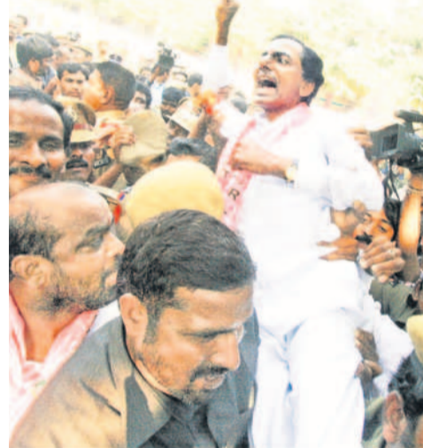
2009 నవంబర్ 29న అల్లుసూర వారసాలో కేసీఆర్ ను అరెస్టు చేస్తున్న పోలీసులు