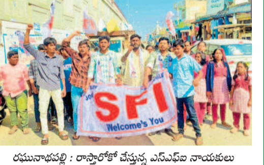
రఘునాథపల్లి : రాష్ట్రంలో చేస్తున్న ఎస్ఎఫ్ఎస్ నాయకులు