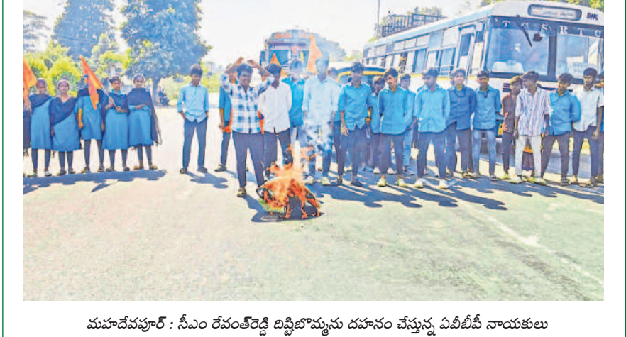
మహాదేవపూర్ : సీఎం రేవంకెరెడ్డి దిష్టిబామ్మల దహనం చేస్తున్న విపివీవీ నాయకులు