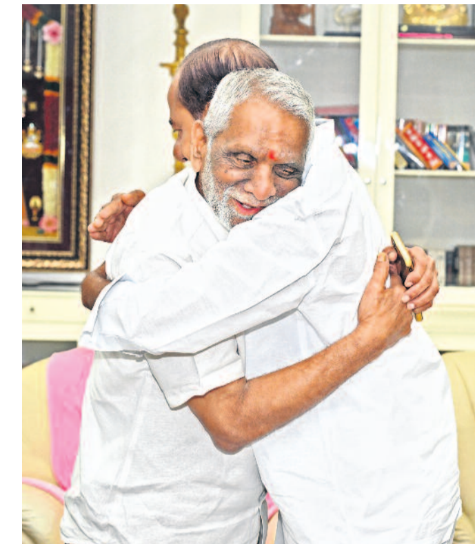
ఎర్రపల్లిలోని తన నివాసంలో ఉద్యమ నహారుడు, మాజీ ఎమ్మెల్యే మాలిరెడ్డి శ్రీనివాసరెడ్డిని ఆత్మీయ అలింగనం చేసుకుంటున్న బీఆర్ఎస్ అధినేత కేసీఆర్