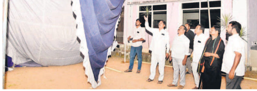
మహబూబ్ నగర్ లోని బీఆర్ఎస్ పార్టీ కార్యాలయంలో ఏర్పాటు చేసిన పరిశీలనకు నాయకులు

కాగా, అధికారంలోకి వచ్చిన కాంగ్రెస్ రాష్ట్రాన్ని ఆరోగి పాలు చేస్తుంది. కాంగ్రెస్ మాయమాటలు సమ్మి ప్రజలు మోసపోయి గోపదతుతున్నారు. ఎక్కడికీ వెళ్లినా కాంగ్రెస్ ప్రభుత్వం ఇచ్చిన హామీలు నిరపేక్షమే దంతో తిరగబడుతున్నాయి. మళ్లీ కేసీఆర్ రాజాలంటూ కోరుకుంటున్నారు. కేసీఆర్ దీక్షను స్ఫురించుకునేందుకు శుక్రవారం అన్ని జిల్లా కేంద్రాల్లో దీక్షా దినం కార్యక్ర మాన్ని భారీ ఎత్తున చేపడుతున్నారు. ఉమ్మడి మహబూ బ్ నగర్ జిల్లాలో అన్ని జిల్లా పార్టీ కార్యాలయాలలో దీక్షా దినం పెద్ద ఎత్తున చేపట్టించుకుంటున్నారు. ఇప్పటికే సన్నాహక సమావేశాలు ఏర్పాటు చేసి కార్యక ర్తలను సిద్ధం చేశారు. కార్యక్రమాన్ని విజయవంతం చేసేందుకు మాజీ మంత్రులు, అలంపార ఎమ్మెల్యేతో పాటు మాజీ ఎమ్మెల్యేలు, ఎమ్మెల్యే, మాజీ కార్యదేష్