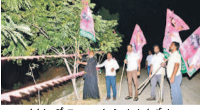
వనపర్తిలో జెండాలను పాతుతున్న నేతలు

మహబూబ్ నగర్, నవంబర్ 28 (సమస్త తెలంగాణ ప్రతినిధి) : మలిదశ తెలంగాణ ఉద్యమంలో కేసీఆర్ చే పట్టిన ఆచరణ నిరాశార దీక్ష చేపట్టి చావు నోట్లో తల పెట్టే తెలంగాణ సాధించారు. ఈ దశలో మళ్లీ పార్టీలో సాతకన కట్టెలు రగిలివేయడం మలిదశ పోరాటంలో భాగంగా 2019 నవంబర్ 29న చేపట్టిన దీక్షతో కేంద్రం దిగివచ్చి డిసెంబర్ 9న తెలంగాణ రాష్ట్ర ఏర్పాటు ప్రక్రి యకు శ్రీకారం చుట్టించింది. ఈ దీక్ష ఫలితమే తెలంగాణ ఏర్పాటుకు నాంది పలికింది. కొట్లాడి సాధించుకున్న తెలంగాణ రాష్ట్రాన్ని పదేండ్లు అన్నికారాలో ఆభివృద్ధిలో పరుగులు పెట్టింది దేశంలోనే నెలంబరవగా నిలిపారు.