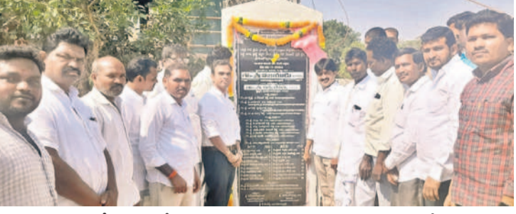
అయిజ పట్టణంలో మిషన్ భగీరథ ప్రైవేట్ శిశుులకున్న ఆవిష్కరణకు మొక్కాళ్ల విజయము