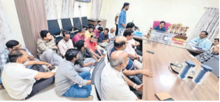
ఫీఫ్ ఇంజినీర్ చాంబర్లో నేలపై కూర్చొని నిరసన తెలుపుతున్న ఇంజినీర్లు

రులు జాగ్రత్తలు తీసుకున్నారు. మహిళా సంఘాలకు చెందిన ముగ్గురు మహిళలతోపాటు పాఠశాల నిబ్బంది తో భోజనం తయారు చేయించారు. విద్యార్థులకు అన్నం, క్యాబిట్, అలగుడత తయారు చేసిన డబ్బు భోజనం పంపింపటం మీడియా కంటపడకుండా అధికా