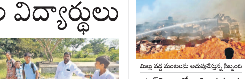
ముల్ల వద్ద మంటలను అదుపుచేస్తున్న సిబ్బంది

రిగా దూరపడడంతో తల్లిదండ్రుల బాధ వర్ణనాతీతం గా మారింది. విషాదభావాలను అలముకున్నాయి. అనుమానాల్ను దృష్టిగా కేసు సమోదా.. ఉపాధ్యాయులు పట్టించుకుంటే నా కోడలు అక్కహా త్య చేసుకునేవారు కాదీ మోసిన ప్రవీణ్ తండ్రి వాపో