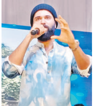
మాట్లాడుతున్న సినీ హీరో విజయ్ దేవరకొండ

కొల్హాపూర్, నవంబర్ 28 : సక్సెస్ మన జీవితంతోపాటు సొసైటీలో కూడా ఎంతో మార్పు వస్తుందని సినీ నటుడు విజయ్ దేవరకొండ అ న్నారు. కొల్హాపూర్ లోని రాజావారి బంగారో రా జీ ఇందిరాదేవి విద్యాసంస్థలో చదివిన పూర్వ వి ద్యార్థులతో స్వర్ణోత్సవం నిర్వహించారు. ఈ వే దుకలకు విజయ్ దేవరకొండ హాజరు కాగా, అభి మానులు పెద్ద ఎత్తున తరలిరావడంతో ఆ ప్రాం తంకూ కొలాహలంగా మారింది. ఈ సంద ర్భంగా విజయ్ మాట్లాడుతూ కొల్హాపూర్ ఎంతో అభివృద్ధి చెందిందని, ఈ ప్రాంతంతో అత్యు య అనుబంధం ఉందన్నారు. ఇక్కడ అర్బండు పాఠ శాల నుంచి భారత దేశంతోపాటు అమెరికా ఇత ర దేశాల్లోని 14 బిల్డీపెలాల లాంటి గొప్ప స్థా నాని నిర్వహింపబడతూ వైస్ చాన్సలర్ గా, వైద్యులగా ఉండ డం అభినందనీయమన్నారు. ఇక్కడీ స్కూల్ నుంచి మై హాం వైరస్ నిర్మూలనతో శుక్రవారం సా యంత్రం కొల్హాపూర్ లో మ్యూజికల్ వైట్ ఏర్పా యలో ఉన్నారని తెలిపారు. తన అమ్మ, మామ య్య ఇక్కడీ చదువుకోవడంతో ఇక్కడి వారితో బంధుత్వం ఉందన్నారు. ఆనంతరం అర్బండు పా