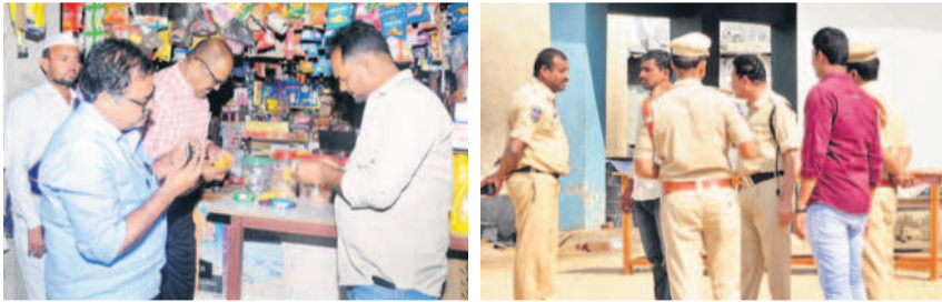
మాగసూరులో కిరాణిదూకాణాలను తనిఖీ చేస్తున్న ఆర్టీవో, పాఠశాల వద్ద పోలీసుల బందోబస్తు

ఉమ్మడి (మాగసూరు), నవంబర్ 28 : మాగసూ ర్ జిల్లా పరిషత్ ఉన్నత పాఠశాల విద్యార్థులు ఫుడ్ పాయి జన్ పరుగు ఘటనపై అధికారులు తీవ్ర హైద్రామాను తలపిస్తోంది. ఈ నెల 20వ తేదీన 100 మంది విద్యార్థు లు వాంతులు, కడుపువొప్ప ఆస్పత్రుకు గురి కాగా, 15 మంది విద్యార్థులు మహబూబ్ నగర్ జిల్లా దవాఖానలో కోలుకునేందుకు ఐదు రోజులు పట్టింది. పాఠశాలలో త ఖ్లిపోయిన కోడి గడ్డు, పురుగులు పట్టిన బియ్యంతో భో