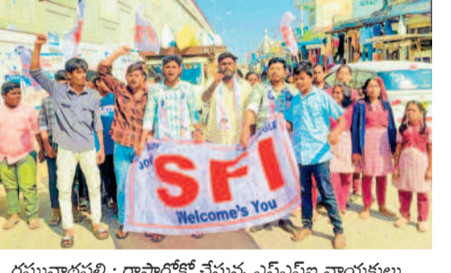
రఘునాథపల్లి : రాష్ట్రంలో చేస్తున్న ఎన్ఎఫ్ఎ నాయకులు