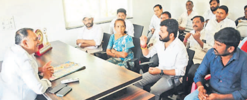
నాయకులు, కార్యకర్తలకు సూచనలు చేస్తున్న భూపాలపల్లి మాజీ ఎమ్మెల్యే గండ్ర వెంకటరమణారెడ్డి

కృష్ణకాలనీ, నవంబర్ 29 : జయశంకర్ భూపాలపల్లి జిల్లా కేంద్రంలో శుక్రవారం రెండు వేల మందితో దీక్షా దివస్ ను నిర్వహించనున్నట్లు మాజీ ఎమ్మెల్యే గండ్ర వెంకటరమణారెడ్డి తెలిపారు. నియోజకవర్గం నుంచి పెద్ద ఎత్తున బీఆర్ఎస్ శ్రేణులు తరలిరావాలని ఆయన పిలుపునిచ్చారు. దీక్షా దివస్ ను గురువారం జిల్లా పార్టీ కార్యాలయంలో నియోజకవర్గ ప్రజా ప్రతినిధులు, ముఖ్య నాయకులు, కార్యకర్తలతో సమీక నిర్వహించారు. ఈ సందర్భంగా గండ్ర మాట్లాడుతూ ప్రతి మండలం నుంచి 200 నుంచి 300, భూపాలపల్లి అర్బన్, రూల్ నుంచి 1,000 నుంచి 1,500 మందిని, మొత్తంగా 2,000 నుంచి 2,500 మందిని తరలిరావాలన్నారు. ఈ కార్యక్రమానికి జిల్లా ఇన్చార్జి, మాజీ మంత్రి, ఎమ్మెల్యే సత్యనాథ రాథోడ్ ముఖ్య అతిథిగా హాజరుకానున్నారని తెలిపారు. కేంద్ర, రాష్ట్ర ప్రభుత్వాలు అనుసరిస్తున్న ప్రజా వ్యతిరేక విధానాలు ఇంటింటికీ తెలిసినా సభను