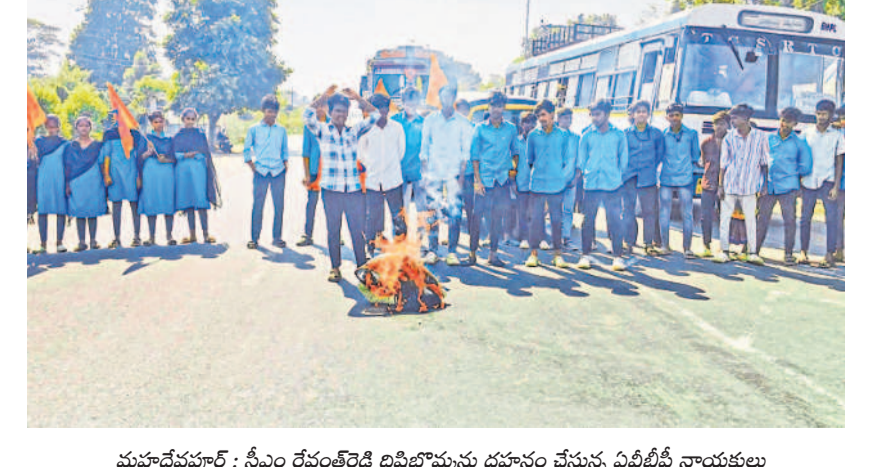
మహాదేవపూర్ : సీఎం రేవంకెరెడ్డి దిష్టిబోమ్మల దహనం చేస్తున్న ఏపీటీసీ నాయకులు