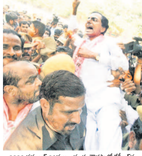
2009 నవంబర్ 29న అల్లుసూర్ వారస్తాలో కేసీఆర్ ను అరెస్టు చేస్తున్న పోలీసులు