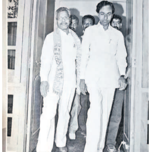
2009 నవంబర్ 29న కేసీఆర్ భవన్ నుంచి ఆమరణ నిరాహార దీక్షకు బయలుదేరుతున్న కేసీఆర్, పక్కన మాజీ ఎమ్మెల్యే నారదాసు

తన దీక్షను కొనసాగించారు. 'నా దీక్ష వల్ల తెలంగాణ వస్తే జైత్రం యాత్ర.. లేదంటే నా శవయాత్ర ఉంటుంది' అని ప్రకటించారు. కేసీఆర్ దీక్షతో తెలంగాణ అగ్నిగండంగా మారింది. ఉద్యమం మరింత ఉగ్రరూపం దాల్చింది. గత్యంతరం లేని పరిస్థితుల్లో కేంద్రం దిగిచ్చి తెలంగాణ ఏర్పాటు ప్రక్రియను ప్రారంభిస్తున్నట్లు ప్రకటించింది. ఆ తర్వాత ప్రత్యేక రాష్ట్రం ఏర్పాడైంది.