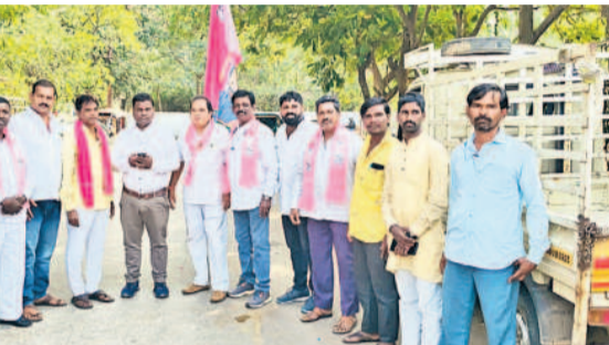
గోషామహల్ నుంచి బీఆర్ఎస్ శ్రేణులతో బయలుదేరిన మహారాష్ట్రకాన్డ తదితరులు