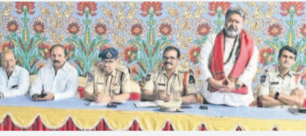
మాట్లాడుతున్న ఈస్టేజ్లోన్ పర్సన్ ప్రెసిడెంట్ శరత్ శ్యామ్, పోలీస్ అధికారులు

కాచిగూడ, నవంబర్ 29: నేరాలు, దొంగతనాలు, అసాంఘిక కార్యక్రమాలకు పాల్పడకుండా సీసీ కెమెరాలను ఏర్పాటు చేసుకోవాలని సెంట్రల్ పీసీ కమిటీ ఈస్టేజ్లోన్ పర్సన్ ప్రెసిడెంట్ ఎన్.శరత్ శ్యామ్ అన్నారు.