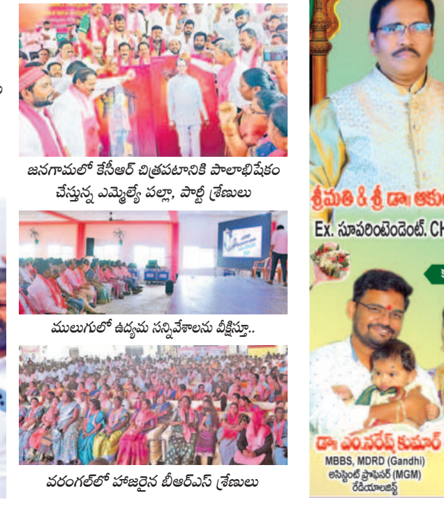
వరంగల్ లో హజరైన బీఆర్ఎస్ శ్రేణులు