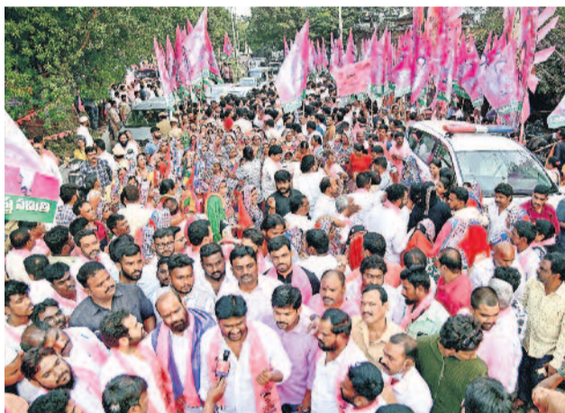
దీక్షా దివస్ సందర్భంగా శుభవారం హైదరాబాద్లోని తెలంగాణభవన్ వద్దకు ర్యాలీగా వస్తున్న బీఆర్ఎస్ నేతలు, కార్యకర్తలు

గుజరాత్ గులాములు ఓ పక్క... ఢిల్లీ కీలుబొమ్మలు మరో పక్క, వీళ్లతో తెలంగాణ ఆత్మగౌరవం, అస్తిత్వానికి పొంచి ఉన్న ప్రమాదం సమైక్యాంధ్ర సంచలన మోసిన తెలంగాణ ద్రోహి సీఎం రేవంత్ రెడ్డి సోనియా లేకుంటే.. తెలంగాణ అడుక్కు తినేదని సీఎం అంటుండడు ఉద్యమాన్ని అవమానిస్తున్నాడు.. అదాని తొక్కుకుంట వస్తున్నాడు భాస్కరమై మండాలె.. ఈ తరంలోనూ ఉద్యమ స్ఫూర్తి నింపాలె తెలంగాణ గొంతు బీఆర్ఎస్ ఒక్కటే.. లగచర్ల విజయం ప్రజలదే తెలంగాణ దీక్షా దివస్ బహిరంగ సభలో మాజీ మంత్రి కేటీఆర్ రాష్ట్రవ్యాప్తంగా ఘనంగా బీఆర్ఎస్ దీక్షా దివస్ సభలు ఉద్యమంలా కదం తొక్కిన బీఆర్ఎస్ నేతలు, కార్యకర్తలు > 2