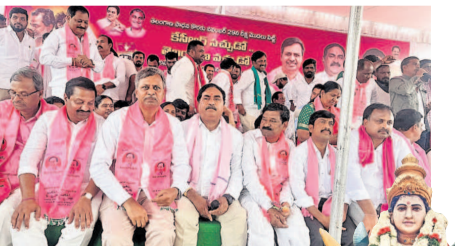
జనగామలో బిక్షా దివస్లో పాల్గొన్న మాజీ మంత్రి ఎర్రబెల్లి, ఎమ్మెల్యే పల్లా, మాజీ ఎమ్మెల్యే రాజయ్య, బీఆర్ఎస్ శ్రేణులు