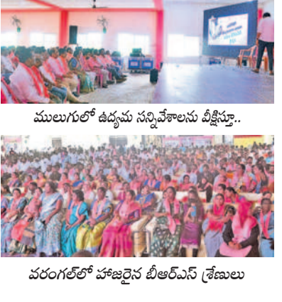
ములుగులో ఉద్యమ సన్నివేశాలను వీక్షిస్తూ..