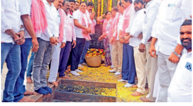
వరంగల్లో హజరైన బీఆర్ఎస్ శ్రేణులు