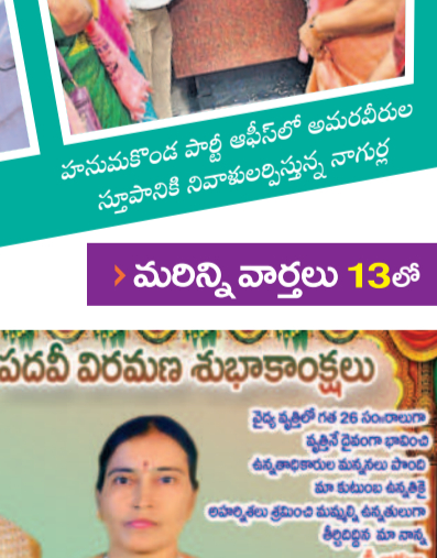
హనుమకొండ పార్టీ ఆఫీస్ లో అమరుల సమాధి నివాళులర్పిస్తున్న నాగర్