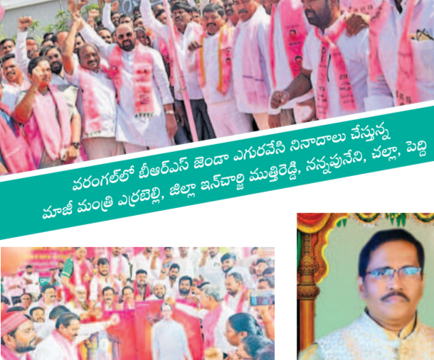
జనగామలో కేసీఆర్ చిత్రపటానికి పాలాభిషేకం చేస్తున్న ఎమ్మెల్యే పల్లా, పార్టీ శ్రేణులు