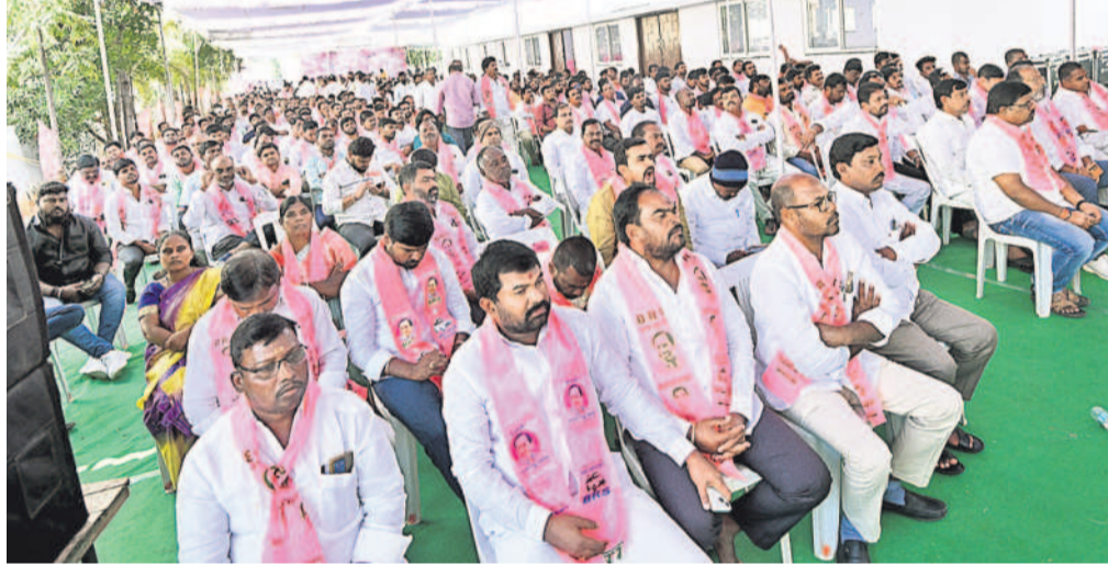
శంషాబాద్ లోని పార్టీ కార్యాలయంలో జరిగిన దీక్షాదివస్ కార్యక్రమానికి హాజరైన బీఆర్ఎస్ శ్రేణులు