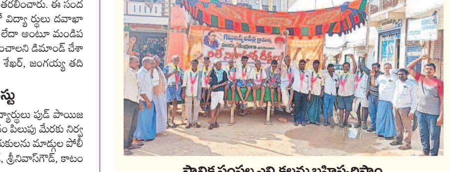
స్థానిక సంస్థల ఎన్నికలను బహిష్కరిస్తూ

పాండవగర్ టౌన్, నవంబర్ 29 : ప్రభుత్వ ఎడ్యుకేషన్ ఫౌండేషన్ ఆధ్వర్యంలో పునాథనగర్ మండలం, లింగాండ్ గ్రామ పరిషత్ ప్రభుత్వ మల్టీ స్ట్రీట్ లైనింగ్ నింటర్లో ఆదివారం మెగా జాబ్ మేళాను నిర్వహిస్తున్న నిర్వహణకుల హస్తం శుభ్రవారం ఓ ప్రకటనలో పేర్కొన్నారు. రంగారెడ్డి జిల్లాలోని నిరద్యోగి యువత యువకుల కోసం హోటల్ మేనేజ్ మెంట్ (హోస్ కేసింగ్, ఫుడ్, బేకరీ కేరీస్, ఫుడ్ ప్రాడక్ షన్, డాటా అంట్), ఆటోమెటీవ్, ఎలక్ట్రికల్, హెల్త్ కేర్ రంగాల్లో శిక్షణ ఇవ్వడంతోపాటు ఉద్యోగ అవకాశాలును అందించారు. ఉదయం 10 గంటలకు జాబ్ మేళా ప్రారంభమవుతుందని, ఇందులో 18-30 ఏండ్ లోపు యువత యువకులు టైన్ నుంచి డిగ్రీ, డిప్లొమా, ఒకేసే కేర్ కోర్సు (పాన్సన్, ఫెయిల్ అయిన) అర్హులున్నారు. అభ్యర్థులు తమ బయోడేటా ఫామ్, అధార్ కార్డు, నాలుగు పాస్ పోర్టు సైజు ఫోటోలు, టైన్, ఇంటర్, డిగ్రీ మెమో జిరాక్ లతో హాజరు కావాల్సింది. మరిన్ని వివరాలకు 83418 84851, 80197 99710 ఈ నెంబర్ లో సంప్రదించాలన్నారు.