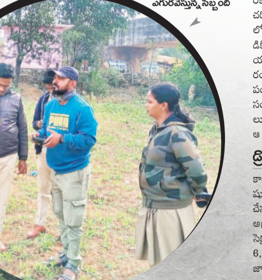
పులిజాడ కోసం డ్రైస్ అవుతున్న నిబ్బంది