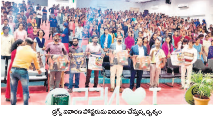
డ్రగ్స్ నివారణ పోస్టరును విడుదల చేస్తున్న డ్రగ్స్