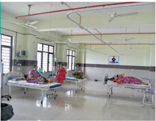
గుండెజబ్బు రోగుల కోసం కేటాయించిన గది

గత ప్రభుత్వం జీజీహెచ్ లో గుండెజబ్బుల వైద్యసేవలను అందించేందుకు సుమారు రూ. 8 కోట్లతో అత్యాధునిక క్యాథ్ ల్యాబ్ మిషన్ అందజేసింది. దీని ఏర్పాటుకు జీజీహెచ్ లో ప్రత్యేక ఏర్పాట్లు చేశారు. గోడలను కూర్చి యంత్రం ఏర్పాటు చేయడంతోపాటు కంప్యూటర్ పరికరాలు చేసేందుకు ప్రత్యేక గది, గుండె ఆపరేషన్ అనంతరం రోగిని పరిశీలనలో ఉంచేందుకు కొన్ని పడకలతో కూడిన ప్రత్యేక గదిని నిర్మించారు. ఇన్ని ఏర్పాట్లు చేసినా క్యాథ్ ల్యాబ్ కు సంబంధించిన వైద్యులు, టెక్నిషియన్లు లేకపోవడం, ప్రభుత్వం చట్టబద్ధమైన వైద్యులను, అడిగి అధికారులు లేకపోవడంతో వైద్యసేవలు ఇంకా ప్రారంభించిన నోచుకోలేదు.