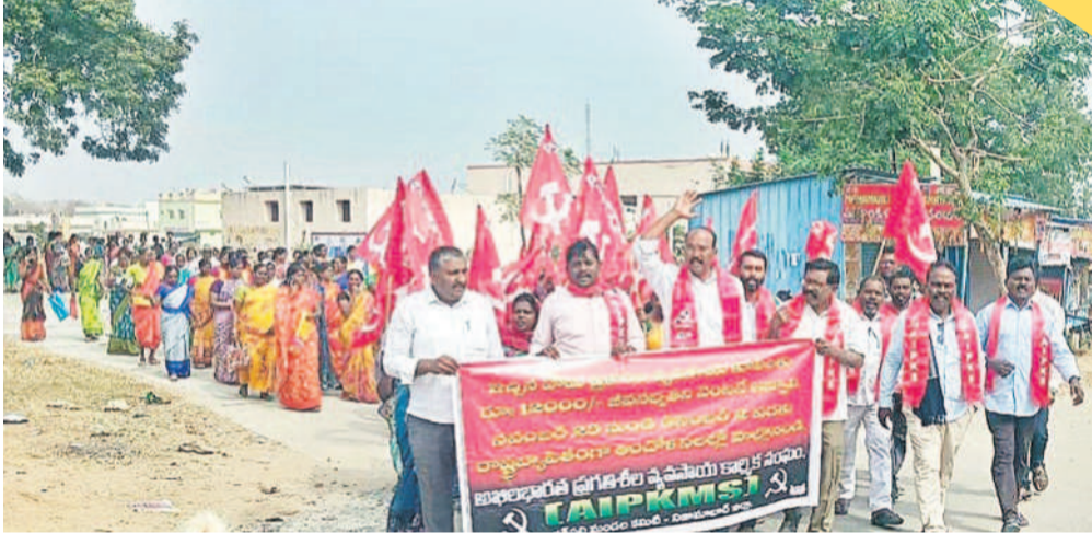
ధర్మలిలో తహసీల్ కార్యాలయానికి రాజీవ్ గా వెళ్తున్న వ్యవసాయ కూలీలు, ఏకమీటిఎంపీ నాయకులు