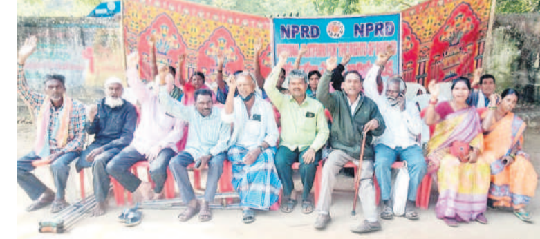
బోధన్ పట్టణంలోని సబ్ కలెక్టర్ కార్యాలయం ఎదుట రిలే నిరాహార దీక్షలు చేస్తున్న దివ్యాంగులు