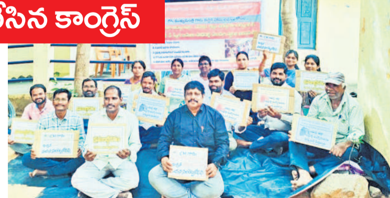
కోటిగల మండలంలోని కేజీబీవీ వద్ద నిరసన తెలుపుతున్న సమగ్రశిక్ష అభియాన్ ఉద్యోగులు