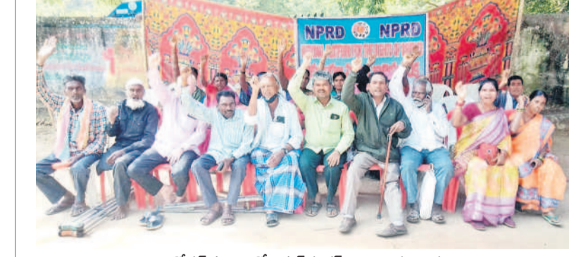
బోధన్ పట్టణంలోని సబ్ కలెక్టర్ కార్యాలయం ఎదుట రిలే నిరాహార దీక్షలు చేస్తున్న దివ్యాంగులు