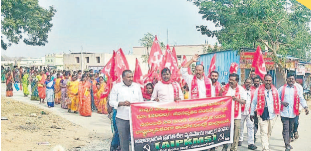
ధర్మలిలో తహసీల్ కార్యాలయానికి రాజీవ్ గా వెళ్తున్న వ్యవసాయ కూలీలు, ఏకమీకేఎంపీ నాయకులు