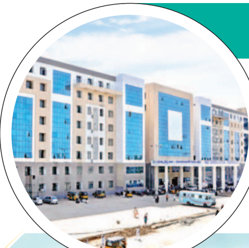
రూ. 8 కోట్లతో ఏడాది క్రితం క్యాథ్ ల్యాబ్ ఏర్పాటు... ప్రారంభం కాని సేవలు

గత ప్రభుత్వం జీజీహెచ్ లో గుండెజబ్బుల వైద్యసేవలను అందించేందుకు సుమారు రూ. 8 కోట్లతో అత్యాధునిక క్యాథ్ ల్యాబ్ మిషన్ అందజేసింది. దీని ఏర్పాటుకు జీజీహెచ్ లో ప్రత్యేక ఏర్పాట్లు చేశారు. గోడలను కూర్చి యంత్రం ఏర్పాటు చేయడంతోపాటు కంప్యూటర్ పరికరాలు చేసేందుకు ప్రత్యేక గది, గుండె ఆపరేషన్ అనంతరం రోగిని పరిశీలనలో ఉంచేందుకు కొన్ని పడకలతో కూడిన ప్రత్యేక గదిని నిర్మించారు. ఇన్ని ఏర్పాట్లు చేసినా క్యాథ్ ల్యాబ్ కు సంబంధించిన వైద్యులు, టెక్నిషియన్లు లేకపోవడం, ప్రభుత్వం పట్టించుకోకపోవడం, అడిగి అధికారులు లేకపోవడంతో వైద్యసేవలు ఇంకా ప్రారంభించిన నోచుకోలేదు.