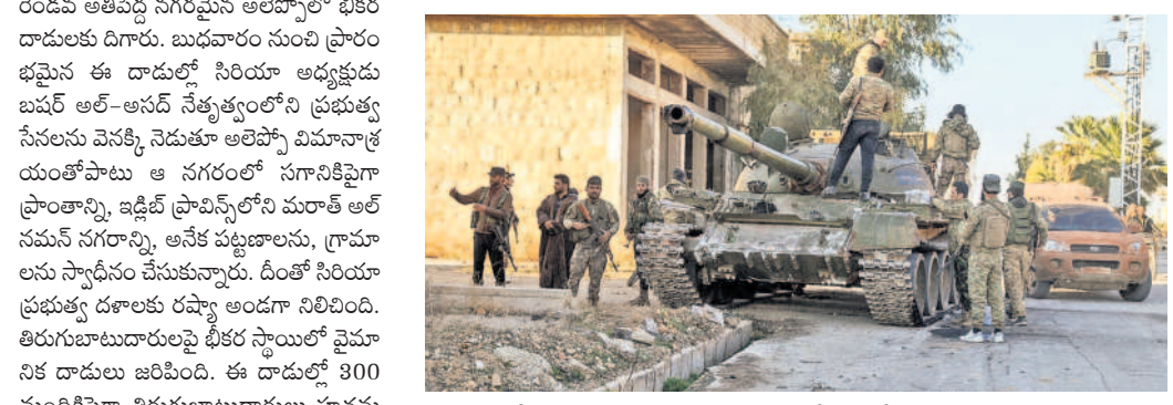
అలెప్పోలో సిరియా యుద్ధ ట్యాంక్లను స్వాధీనం చేసుకున్న తిరుగుబాటుదారులు

న్యూఢిల్లీ, డిసెంబర్ 1: అంతర్జాతీయ దాదాపు దశాబ్ద కాలంపాటు అట్టడికీసిన సిరియాలో మళ్ళీ సంక్షోభం మొదలైంది. అంతర్జాతీయ ఉగ్రవాద సంస్థ అల్-ఖైదాకు అనుబంధంగా పనిచేస్తున్న 'హుయత్ తక్షీర్ అల్-షామ్' ఇస్లామిక్ గ్రూపులకు చెందిన సాయుధ తిరుగుబాటుదారులు సిరియాలో రెండవ అతిపెద్ద నగరమైన అలెప్పోలో భీకర దాడులకు దిగారు.