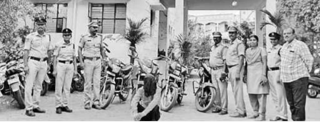
నిందితుడి అరెస్టును చూపుతున్న పోలీసులు