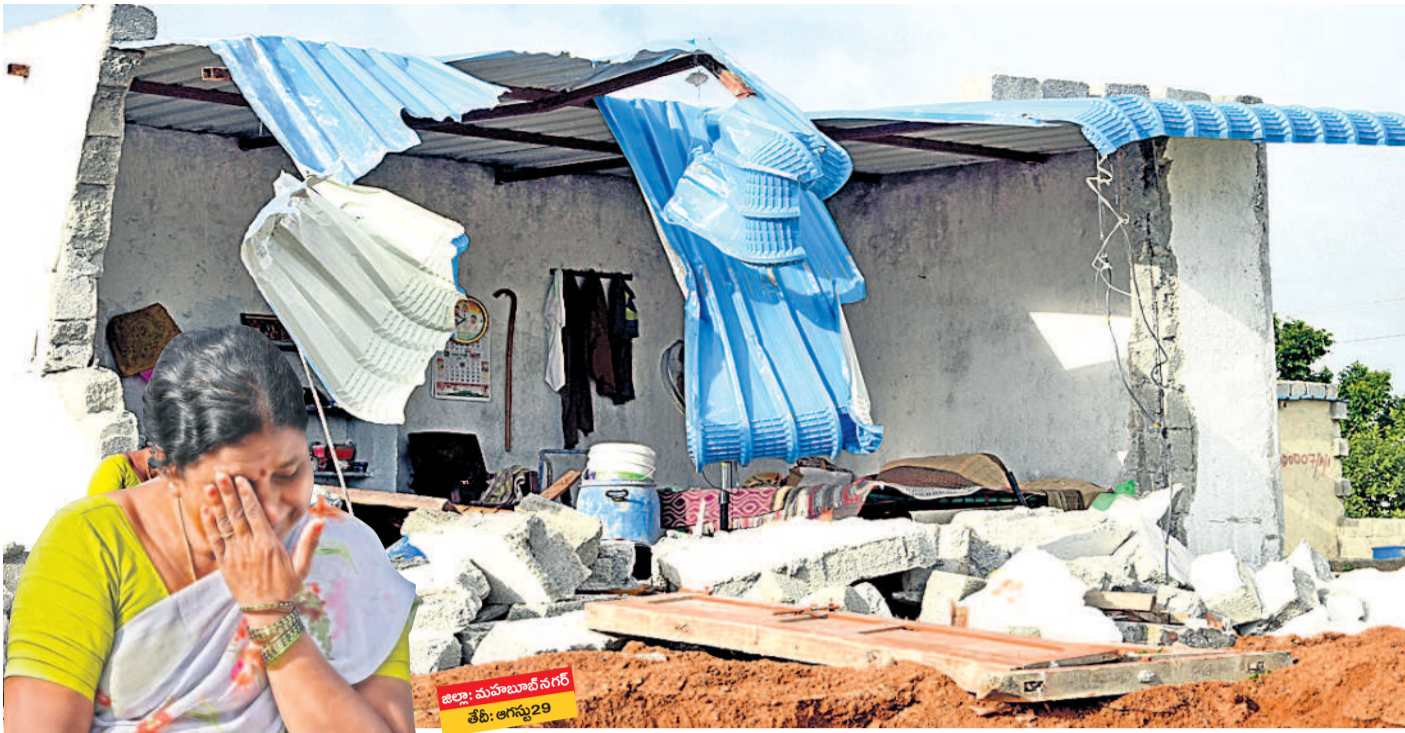
జిల్లా: మహబూబ్ నగర్ తేది: అగస్టు 29

మహబూబ్ నగర్ అదర్బన్ గర్లోని 70 మంది దివ్యాంగుల ఇండ్లను మున్సిపల్ అధికారులు కూల్చగా, కూలిన ఇంటి వద్ద కన్నీరుమున్నీరుగా విలపిస్తున్న బాధిత మహిళ