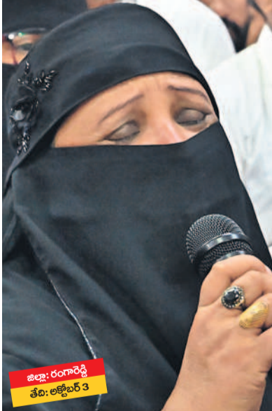
జిల్లా: రంగారెడ్డి తేది: అక్టోబర్ 3

గ్రూప్ 1 బరక్షర్ పెద్దూల్ చేయాలని నిర్ణయించిన అందోగనలో రోదీస్తున్న నిరుద్యోగి