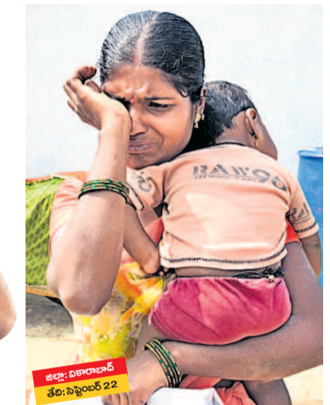
జిల్లా: వికారాబాద్ తేది: సెప్టెంబర్ 22

మహబూబ్ నగర్ జిల్లా కేంద్రం అదర్బన్ గర్లోని దాదాపు 70 మంది దివ్యాంగుల ఇండ్లను మున్సిపల్ అధికారులు కూల్చగా, కూలిన ఇంటి నుంచి సామగ్రి తీసుకుంటూ కన్నీరుమున్నీరుగా విలపిస్తున్న బాధిత మహిళ