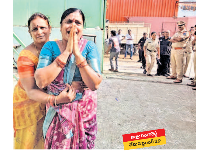
జిల్లా: రంగారెడ్డి తేది: సెప్టెంబర్ 22

తెలంగాణభవన్ లో బీఆర్ఎస్ వర్కింగ్ ప్రెసిడెంట్ కేటీఆర్ తన గోడు చెబుతూ కన్నీటిపర్యంతమైన హైద్రా బాధితురాలు