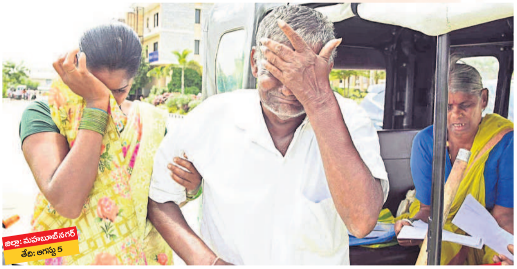
జిల్లా: మహబూబ్ నగర్ తేది: అగస్టు 5

తమకు అన్నం పెడుతున్న భూములను లగవర్ణ ఫార్మా క్లస్టర్ కోసం బలవంతంగా లాక్స్ వద్దం దండం పెడుతూ, రోదీస్తూ ప్రభుత్వాన్ని అధికారులను వేడుకుంటున్న వ్యధురాలు