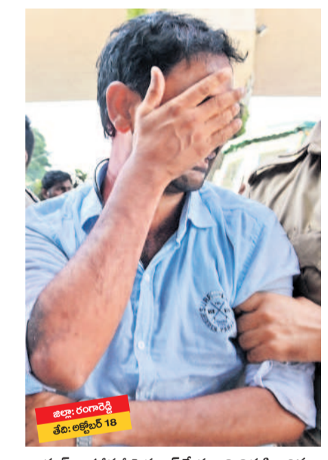
జిల్లా: రంగారెడ్డి తేది: అక్టోబర్ 18

పోలీసులు తమ వారిని అరెస్టు చేయడంతో కన్నీటి పర్యంతమవుతున్న లగవర్ణ ఫార్మా బాధితురాలు