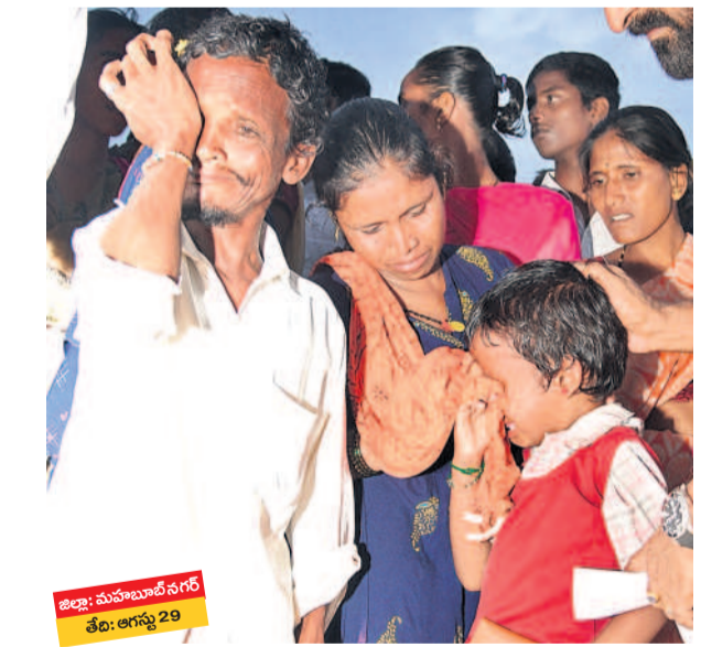
జిల్లా: మహబూబ్ నగర్ తేది: అగస్టు 29

తెలంగాణభవన్ లో కేటీఆర్ ఎదురు ఆవేదన వెళ్లిగక్కతున్న మూసీ బాధితురాలు