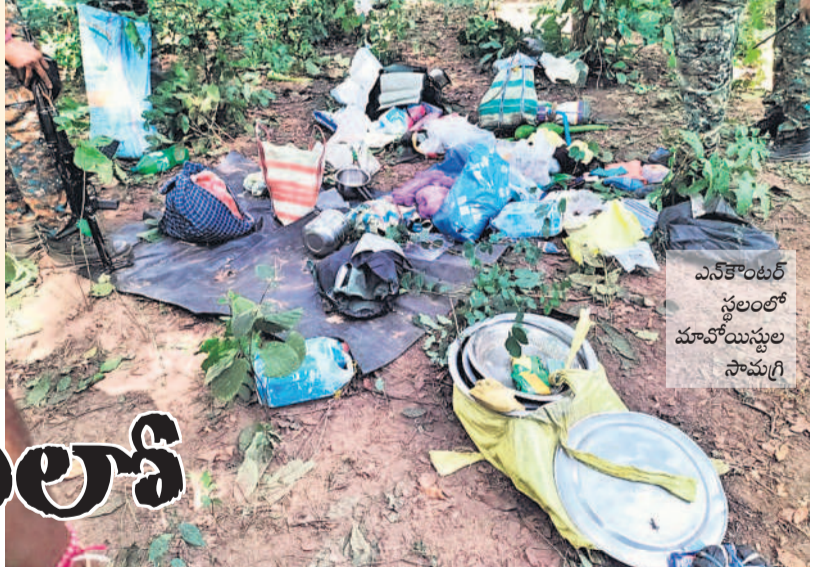
ఎన్కౌంటర్ స్థలంలో మావోయిస్టుల సామగ్రి