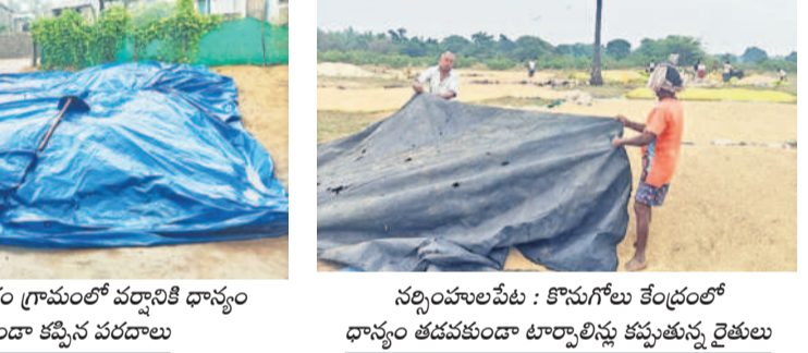
వాజేడు : దర్శనం గ్రామంలో వర్షానికి దాస్యం తడవకుండా కప్పిన పరదాలు