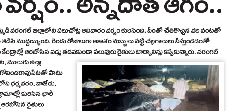
నర్సింహలపేట : కొనుగోలు కేంద్రంలో దాస్యం తడవకుండా టూల్స్ లిఫ్ట్ కప్పితున్న రైతులు