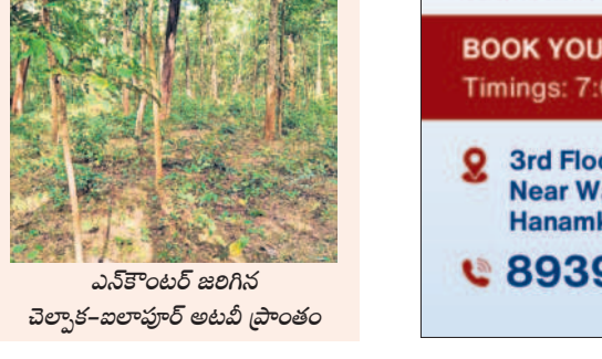
ఎన్కౌంటర్ జరిగిన చెల్లాక-బలాపూర్ అటవీ ప్రాంతం