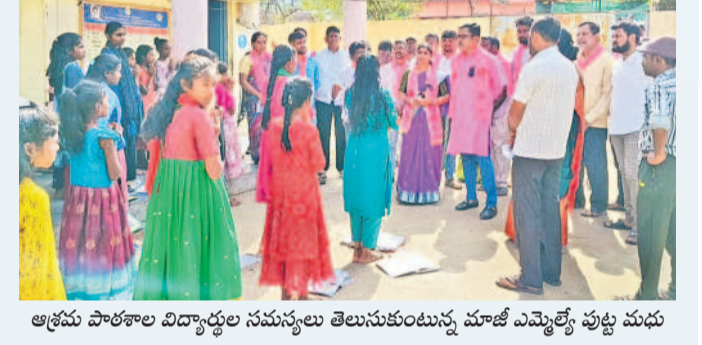
ఆశ్రమ పాఠశాల విద్యార్థుల సమస్యలు తెలుసుకుంటున్న మాజీ ఎమ్మెల్యే పుట్ల మధు