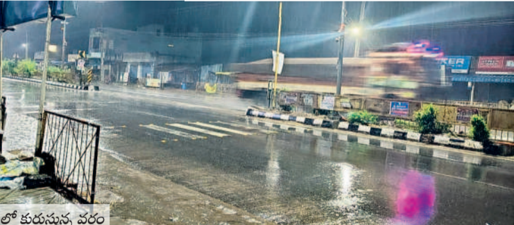
గోవిందరావుపేటలో కురుస్తున్న వర్షం

తుపాని కారణంగా ఉమ్మడి వరంగల్ జిల్లాలోని పలుచోట్ల ఆదివారం వర్షం కురిసింది. దీంతో చేతికొచ్చిన వరి పంటతో పాటు వత్తి, ధాన్యం తడిసి ముద్దయ్యింది. రెండు రోజులుగా ఆకాశం ముబ్బులు పట్టి చల్లగాలులు వీస్తుండడంతో కల్వాయి, కొనుగోలు కేంద్రాల్లో అరబోసిన వడ్లు తడవకుండా పలువురు రైతులు టూల్స్ లిఫ్ట్ కప్పిస్తున్నారు. వరంగల్ జిల్లా చెన్నారావుపేట, ములుగు జిల్లా ఏటూరునాగారం, గోవిందరావుపేటలో పాటు వాజేడు మండలంలోని ధర్మవరం, వాజేడు, ప్రగల్భ వల్లి తదితర గ్రామాల్లో కురిసిన భారీ వర్షంతో ధాన్యాన్ని అరబోసిన రైతులు ఆగమయ్యారు. కోసిండుకు నిర్ధంగా ఉన్న వరి తడిస్తే తీవ్రంగా నష్టపోతామని పలువురు అన్నదాతలు ఆందోళన చెందుతున్నారు. - ఏటూరునాగారం/ గోవిందరావుపేట/ వాజేడు/ సర్పంచలపేట/ చెన్నారావుపేట, డిసెంబర్ 1