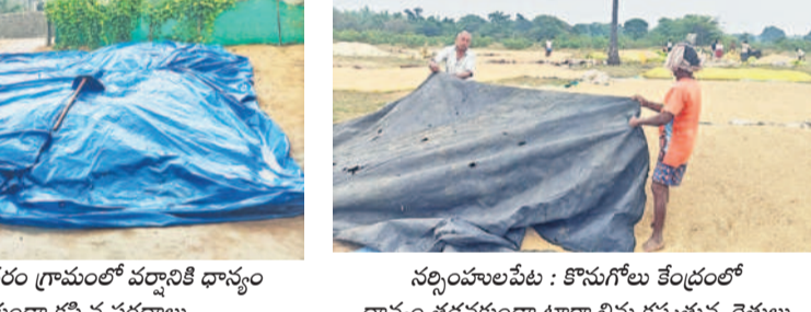
సర్పంచలపేట : కొనుగోలు కేంద్రంలో దాస్యం తడవకుండా టూల్స్ లిఫ్ట్ కప్పిస్తున్న రైతులు