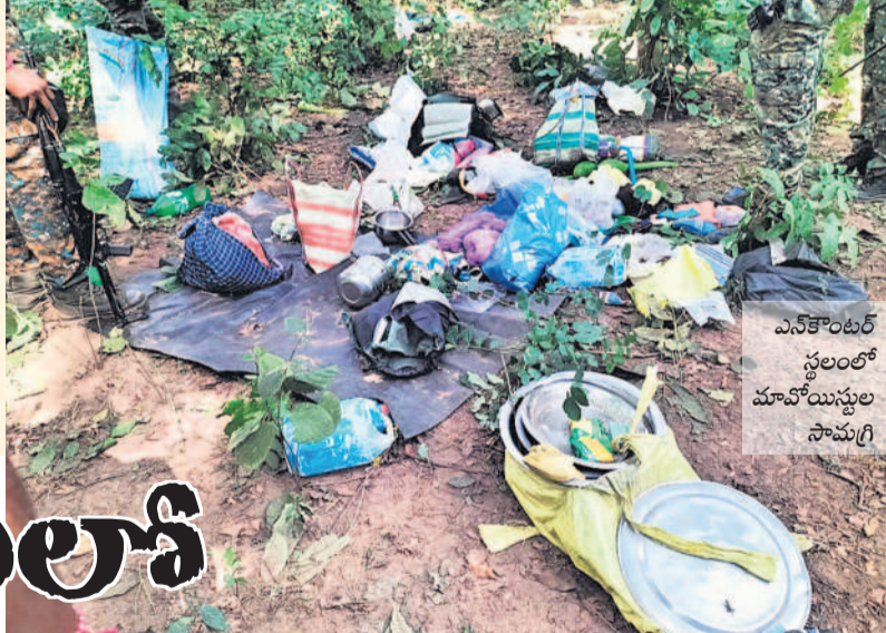
ఎన్కౌంటర్ స్థలంలో మావోయిస్టుల సామగ్రి