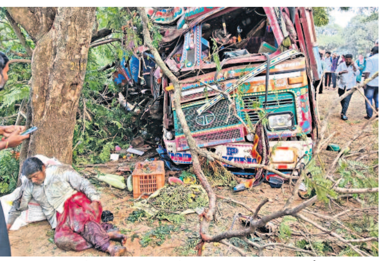
రంగారెడ్డి జిల్లా చేవెళ్ల మండలం అలూర్ గేట్ వద్ద సోమవారం సాయంత్రం రోడ్డు పక్కన కూరగాయలు అమ్ముతుండన్న చిరువ్యాపారుల పైకి వేగంగా దూసుకొచ్చిన లాభి