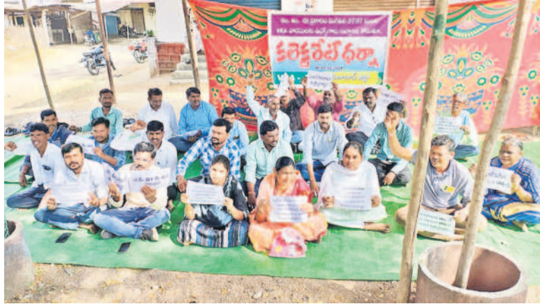
కలెక్టరేట్ ఎదుట ధర్నా చేస్తున్న వీఆర్ఎస్