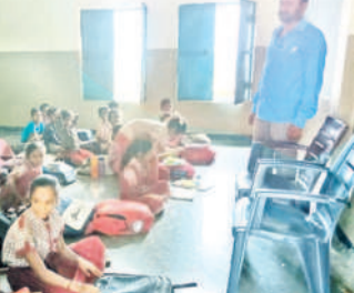
మూడు తరగతుల విద్యార్థులకు ఒకే తరగతి గదిలో

సోన్, డిసెంబర్ 2 : సోన్ మండలంలోని గంజాల్ ప్రాథమిక పాఠశాలలో సుమారు 50 మంది విద్యార్థులు విద్యను అభ్యసిస్తున్నారు. ఇక్కడ ఒకే తరగతి నుంచి ఐదు తరగతులు ఉండగా.. ఒకే ఒక్క ఉపాధ్యాయుడు బోధిస్తున్నాడు. ఒక్క తరగతి గదిలో ఒకటి, రెండు తరగతి విద్యార్థులను కూర్చోబెట్టిగా, 3,4,5 తరగతుల విద్యార్థులు వేరే గదిలో కూర్చోబెట్టి చెబుతున్నారు. ఈ పాఠశాలలో ముగ్గురు ఉపాధ్యాయులకు ఒక్క ఉపాధ్యాయులు ద్వితీయిక