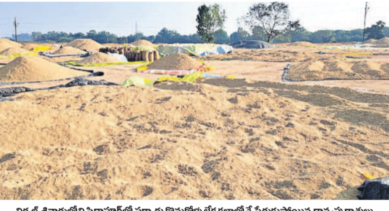
నిర్మల్ శివారంలోని సిద్ధాపూర్లో సర్కారు కొనుగోళ్లకు లోక కల్లాల్లోనే పేరుకుపోయిన ధాన్యపు రాకులు