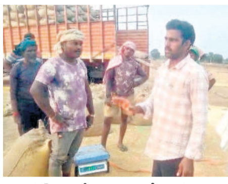
తుఫాన్ భయంతో తక్కువ ధరకు పైపేటు వ్యాపారులకు అమ్ముకుంటున్న రైతులు

నిర్మల్, డిసెంబర్ 2(నమస్తే తెలంగాణ) : నిర్మల్ వరకు ధాన్యం రైతుల సర్కారు ఓ పైపు. దళారులు మరో వైపు తీవ్ర ఇబ్బందులు పాలు చేస్తుండగా.. ప్రస్తుతం ప్రకృతి రూపంలో ఫెంగల్ తుఫాన్ ఆందోళన గురి చేస్తున్నది. ఇప్పటికే ధాన్యాన్ని అమ్ముకునేందుకు ఆసాహించి పడుతున్న అన్నదాతకు గౌరవ చుట్టపై లోకటి పోటులాగా ఈ తుఫాన్ ప్రభావం వెంటాడుతున్నది. ఫెంగల్ తుఫాన్ తీవ్రత విస్తరిస్తున్న కారణంగా ఆకాశంకా ముల్లులు పట్టడంతో కారణం, వర్షాలు కురవవచ్చని వాతావరణ శాఖ చేస్తున్న హెచ్చరికలకు రైతులను ఆవేదనకు గురి చేస్తున్నాయి. ప్రస్తుతం జిల్లాలో ప్రభుత్వ కొనుగోళ్ల ప్రక్రియ అప్రవృత్తంగా మారడంతో రైతుల ధాన్యంకా కల్లాల్లోపాలు, కొనుగోలు కేంద్రాల్లో కుప్పలు తెప్పలుగా పేరుకుపోయాయి. కొనుగోలు కేంద్రాల్లో తేమ, తప్పి, తాలుతోపాటు గన్నీ బ్యాగుల కొరత కారణంగా లక్షన్న మేరకు కొనుగోలు ప్రక్రియ ముందుకు సాగడం లేదన్న విమర్శలున్నాయి. ఒకవైపు మండలకార్యాలయం సాగుతున్న కొనుగోళ్లపాటు, ఏ సమయంలోనైనా వర్షం కురిసి అవకాశాలు ఉన్నట్లు వాతావరణ శాఖ చెబుతుండడంతో రైతులు ఆరభిస్తున్న ధాన్యాన్ని ఎక్కడ నిలువ చేయాలి అర్థం కాక తలలు పట్టుకుంటున్నారు. దాదాపు 45 ఏళ్ల శ్రీశ్రీ జిల్లా వ్యాప్తంగా ధాన్యం కొనుగోళ్లను ప్రారంభించినప్పటికీ బోసన్ స్పెల్ల సృష్టత లేకపోవడం, మిల్లర్ల వ్యవహారం కారణంగా ఇప్పటి వరకు కనీస స్థాయిలో కూడా లక్ష్యాన్ని చేరుకోలేకపోవడం రైతులను ఆందోళనకు గురిచేస్తున్నది.