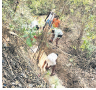
కవ్వల శివారంలో ఎదుట కాలవలో పూడిక తీస్తున్న రైతులు