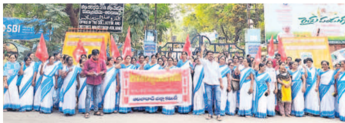
కలెక్టరేట్ ఎదుట ధర్నా చేస్తున్న ఆశ కార్యకర్తలు