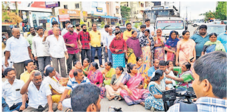
హత్య చేసినవారిని అరెస్టు చేసిన కఠినంగా శిక్షించాలని డిమాండ్ చేస్తూ సాగరరాజులపై రాష్ట్రాలో చేస్తున్న కేటీవీఎస్ నాయకులు