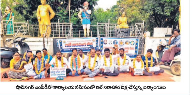
షాద్ నగర్ లో అంటిషో కార్యక్రమం సమీపంలో లలే నిరాహార దీక్ష చేస్తున్న దివ్యాంగులు