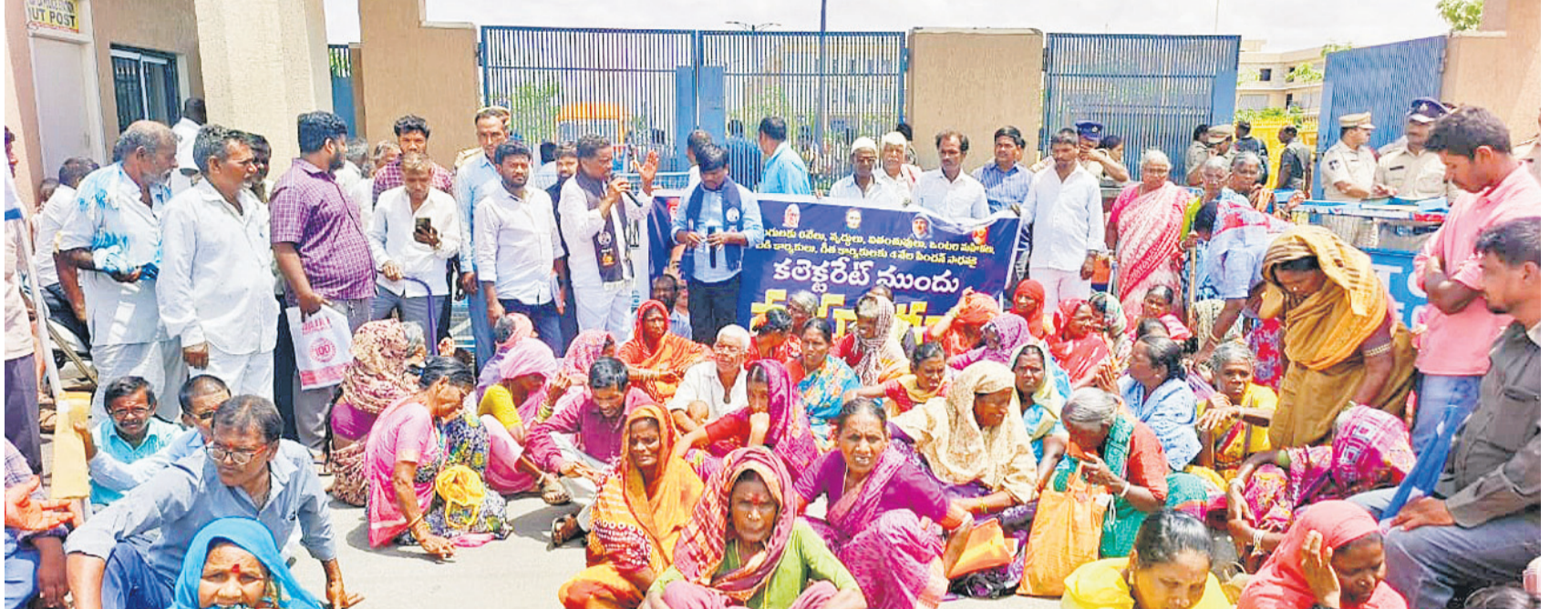
రంగారెడ్డి కలెక్టరేట్ ఎదుట ఆందోళన చేస్తున్న దివ్యాంగులు