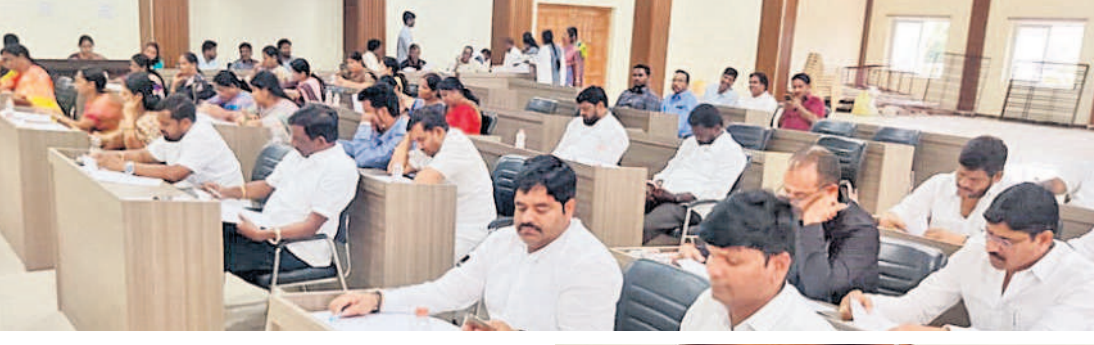
వారు. 32 డివిజన్లలో కొంత మందికి మాత్రమే ఇష్టానుసారంగా నిధులు కేటాయింపడం పట్ల సమావేశంలో సభ్యులు మండిపడ్డారు.

అధ్యాక్ష పనులు ఎలా చేస్తారు: కార్పొరేటర్ల శంకర్ బెండర్ వేయకుండానే అధ్యాక్ష పనులు ఎలా చేస్తారని గుర్రంగూడ కార్పొరేటర్ బెండర్ దక్షిణ శంకర్ ప్రశ్నించారు. అసలు కార్పొరేషన్ లో వార్షిక బడ్డెట్ ఎంతో తేలికగానే నిర్వహించాలి. మూడు కౌన్సిల్ సమావేశాల్లో రూ.160 కోట్ల బడ్డెట్ పెట్టారని తెలిపారు. అసలు బడ్డెట్ లేకుండా అధ్యక్షులు పనులు చేస్తే ఎలా అన్నారు. కొంత మంది కార్పొరేటర్లకు కోట్ల నిధులు ఏ పద్ధతి ప్రకారం కేటాయిస్తున్నారో చెప్పాలని డిమాండ్ చేశారు. ఇప్పటి వరకు పాత బెండర్ కాబేద న్నారు. బెండర్ ప్రక్రియ లేకుండానే అధ్యాక్షులు పనులు ఎలా చేయాలని అడిగారు అని నిలదీశారు. కౌంటి ఇన్వెన్ తర్వాతే సమావేశం జరగాలన్నారు.