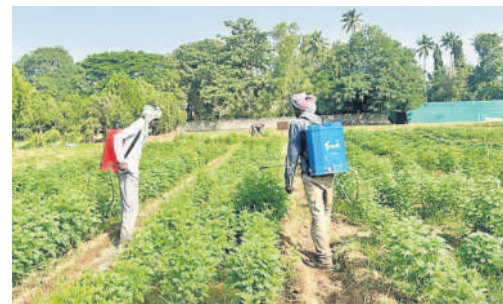
వీడవీడల నివారణకు వివికార్