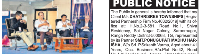
ఆధునిక విధానంతో క్యాన్సర్ కు చికిత్స