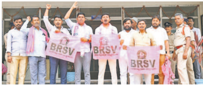
సంగారెడ్డి పీఎస్ ఆఫీసులో నిరసన తెలుపుతున్న బీఆర్ఎస్ వీ నాయకులు

సంగారెడ్డి కలెక్టరేట్, డిసెంబర్ 2: జిల్లాలో గురుకుల బాట పట్టిన బీఆర్ఎస్ వీ నాయకులను పోలీసులు అరెస్టు చేశారు. గురుకుల పాఠశాలలు, కేజీబీవీ, సరక్షేమ వసతి గృహాల్లో విద్యార్థులు ఎదుర్కొంటున్న సమస్యలు తెలుసుకునేందుకు బీఆర్ఎస్ వీ అధ్యక్షులతో గురుకుల బాటకు పిలువనిచ్చిన విషయం తెలిసింది. సోమవారం సంగారెడ్డి లోని కస్తూర్బా గురుకుల పాఠశాలను సందర్శించేందుకు బయలుదేరిన బీఆర్ఎస్ వీ నాయకులను పట్టుకు పోలీసులు అరెస్టు చేసి పీఎస్ ఆఫీసు తరలివచ్చారు. సాయంత్రం సొంత ఘాటికత్తు వారిని విడుదల చేశారు. ఈ