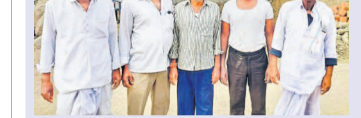
నిరసన వ్యక్తం చేస్తున్న సంగారెడ్డి జిల్లా న్యాయాధికారి మండలం అమీరాబాద్ రైతులు