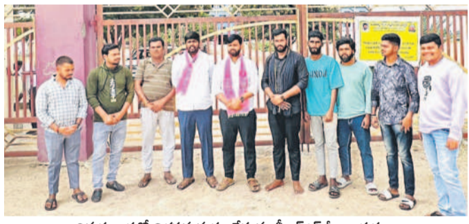
చిన్నకంజిపల్లి నిరసన వ్యక్తం చేస్తున్న బీఆర్ఎస్ వీ నాయకులు

పటాన్చెరు, డిసెంబర్ 2: బీఆర్ఎస్ వర్కింగ్ ప్రెసిడెంట్ కేసీఆర్, బీఆర్ఎస్ వీ రాష్ట్ర అధ్యక్షుడు గెల్లు శ్రీనివాస్ యాదవ్ ఆదేశాల మేరకు బీఆర్ఎస్ వీ నాయకులు హాస్టళ్లను సందర్శించేందుకు వెళ్ళా పోలీసులు వారిని అడ్డుకున్నారు. సోమవారం సంగారెడ్డి జిల్లా పటాన్చెరు మండలం చిన్నకంజిపల్లిలోని మహాత్మాజ్యోతిరావు పూలే బీసీ గురుకుల పాఠశాలలో ఉన్న సమస్యలు తెలుసుకునేందుకు బీఆర్ఎస్ నియోజకవర్గ విద్యార్థి విభాగం నాయకులు వెళ్ళారు. అప్పటికే గేటు ముందు పహారా కాస్తున్న పోలీసులు బీఆర్ఎస్ వీ నాయకులను అడ్డుకున్నారు. లోపలికి వెళ్ళాలని చెబుతూ గేట్లు మూసివేశారు. ఈ సందర్భంగా బీఆర్ఎస్ వీ నియోజ