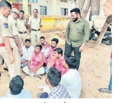
బీఆర్ఎస్ నాయకులను అరెస్టు చేస్తున్న పోలీసులు