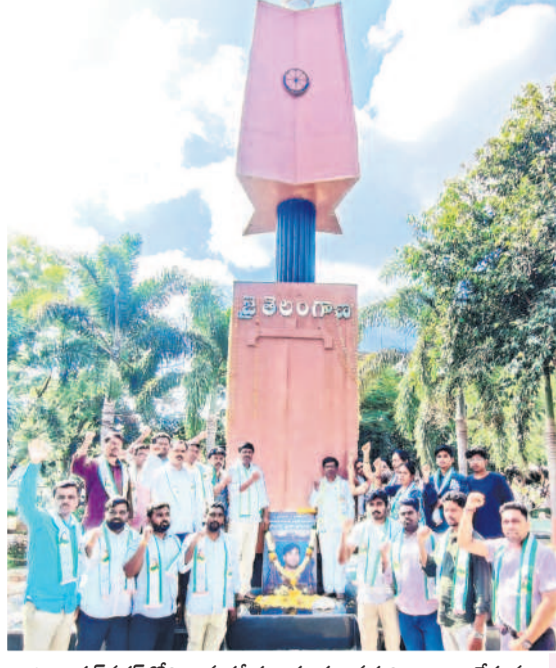
వినాయక్ నగర్ లోని అమరవీరుల స్తూపం వద్ద నివాదాలు చేస్తున్న తెలంగాణ జాగృతి ప్రతినిధులు