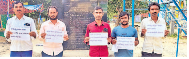
మహబూబాబాద్ జిల్లా నర్సింహులపేటలో రుణమాఫీ చేయాలని ప్లకార్డులతో ధర్నా చేస్తున్న రైతులు