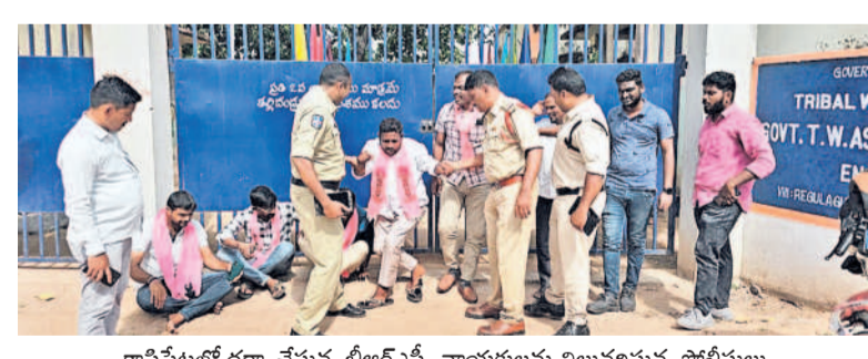
కానీపేటలో ధర్నా చేస్తున్న బీఆర్ఎస్ నాయకులను నిలువలస్తున్న పోలీసులు

రెడ్డి అని ఆగ్రహం వ్యక్తం చేశారు. కాంగ్రెస్ 11 నెలల పాటునే గురుకుల పాఠశాలను, సాంఘిక సర్వేకమ హాస్టల్ మధ్య భోజనం తినే విద్యార్థుల పరిస్థితి మాస్టరు కన్నీళ్లు వస్తున్నాయని ఆవేదన వ్యక్తం చేశారు. గురుకులాల్లో విద్యార్థులకు కనీసం నీటి ప సేవ కూడా లేదని, నాణ్యమైన బోజనం అందించడం