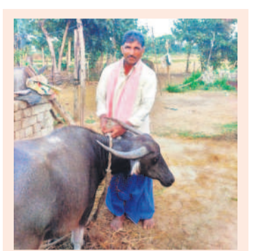
సగం మందికే రుణమాఫీ