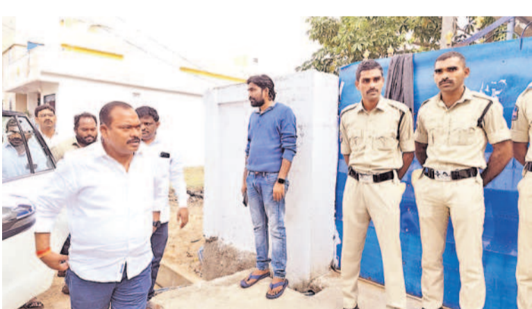
వేములవాడలోని బోయినపల్లి గురుకుల పాఠశాల వద్దకు మాజీ ఎమ్మెల్యే రుణం కర