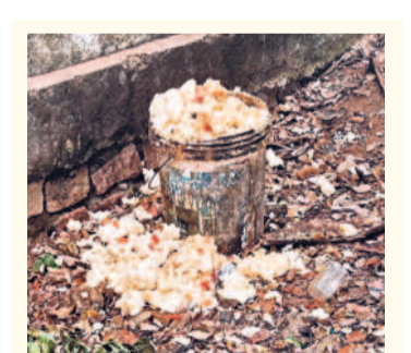
పడేసిన మధ్యాహ్న భోజనం..

ఉన్నతంగా తీర్చిదిద్దాలని కేసీఆర్ 1029 పాఠశాలలను నెలకొల్పాడని, ఒక్కో విద్యార్థికి రూ.1.20 లక్షలు ఖర్చు చేసి నాణ్యమైన పోస్ట్ ప్రాజెక్టుతో పాటు మెరుగైన విద్యను అందించిన విషయాన్ని గుర్తుచేశారు. అలాంటి గురుకులాలను కాంగ్రెస్ ప్రభుత్వం వచ్చాక పట్టింపుకోక పోవడంతో విద్యార్థుల జీవితాలు అధ్వానంగా మారి నట్లు ఆవేదన వ్యక్తం చేశారు. కలుషిత ఆహారం తిని వందలాదిమంది ఆస్పత్రులకు గురవుతున్నారని తెలిపారు. పడుల సంఖ్యలో విద్యార్థుల మరణం, అత్యుపాధులు వంటివి జరుగుతున్నా ప్రభుత్వం చర్యలు చేపట్టడం లేదని మండిపడ్డారు.