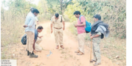
దిల్లంపల్లి : విరుతపులి అడుగులను గుర్తించేందుకు అటవీ సిబ్బంది

కుర్రులం పీఠం ఆసిఫాబాద్, డిసెంబర్ 3 (సమస్తి తెలంగాణ) : జిల్లాలో పులి అలజడి ప్రజలను భయాందోళనకు గురిచేస్తున్నది. ముఖ్యంగా కాగజేనగర్ డివిజన్ లో నిత్యం ఏదో ఒక చోట పులి కనిపిస్తూనే ఉన్నది. ఇటీవల ఇద్దరిపై పులిదాడి చేసిన సేపట్లలో అటవీ అధికారులు దాని జాడను గుర్తించేందుకు ప్రత్యేక చర్యలు చేపట్టారు. ఇటీవల పులిదాడి అటవీ ప్రాంతంలో 20 సీసీ కెమెరాలు, కాగజేనగర్ డివిజన్ లోని అటవీ ప్రాంతంలో 80 సీసీ కెమెరాలను ఏర్పాటు చేశారు. మంగళవారం వాంకడి మండల కేంద్రానికి సమీపంలో చేసుకోవలసిన చర్యలకు పులి గాండ్రంపుల వినపడగా, సున్నుకో లోయాడని సోఫర్ల మీడియాలో వెల్లడం