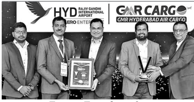
శంషాబాద్ ఎయిర్ కార్గోకు గోల్డెన్ అవార్డు

శంషాబాద్ రూరల్, డిసెంబర్ 3: హైదరాబాద్ విమానాశయానికి మరో అవార్డు వరించింది. శంషాబాద్ ఎయిర్ కార్గోకు 'గోల్డెన్' అవార్డును గౌరవించారు.