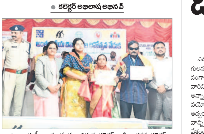
దివ్యాంగ శ్రీధాకారలను సన్మానిస్తున్న కలెక్టర్, జడ్జి, అదనపు కలెక్టర్

నిర్వర్త వైసిగ్, డిసెంబర్ 3 : దివ్యాంగుల సంక్షేమానికి కేంద్ర, రాష్ట్ర ప్రభుత్వాలు అమలు చేస్తున్న పథకాలను వినియోగించుకోవాలి అభిలాషి అని పలుకుతున్నారు.