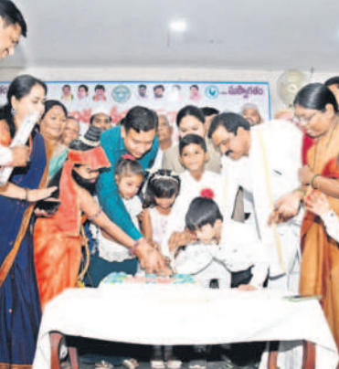
పిల్లలతో కలిసి కేక్ కట్ చేస్తున్న కలెక్టర్, ఎమ్మెల్యే, అధికారులు

పాఠశాలను సన్మానిస్తున్న కలెక్టర్, జడ్జి, అదనపు కలెక్టర్