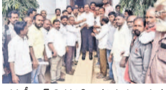
తహసీల్దార్ భిక్షుతిడి వివరించడం ఇస్తున్న జిన్నారం గ్రామస్వయం

బోల్తూర్, డిసెంబర్ 3: ప్రభుత్వ భూమిని ప్రైవేట్ వెంచర్ నిర్వాహకులకు కట్టబెట్టేందుకు కుట్ర జరుగుతోందని జిన్నారం గ్రామ స్వయం అసోషియేషన్ వ్యక్తం చేశారు. ఈ మేరకు పోలీస్ డివిజన్ కలెక్టర్ కలిసి మంగళవారం వినతిపత్రం అందజేశారు. ఎమ్మెల్యే గూడెం మహిపాలిరెడ్డి పేదలకు ఇండ్ల స్థలాలు ఇస్తానన్న హామీని నిలబెట్టుకోవాలని డిమాండ్ చేస్తూ ప్రజలు తహసీల్ కార్యాలయం ఎదుట ధర్నా చేపట్టారు. ఈ భూముల్లో మిగిలి ఉన్న స్థలాన్ని పేదలకు కేటాయించాలని, లేనిపక్షంలో అసోషియేషన్ వేదకామని