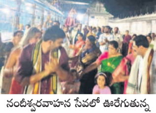
నందిశ్వరవాహన సేవలో ఊరేగింపును బోంతపల్లి వీరభద్రస్వామి