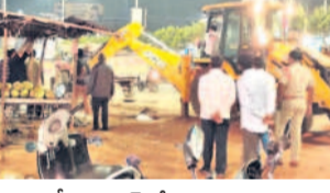
జహీరాబాద్లో ఆక్రమణలను జేసిన తొలిగింపు పోలీసులు

జహీరాబాద్, డిసెంబర్ 3: జహీరాబాద్ లో ట్రాఫిక్ ప్రమాదాలు, వాహనదారులకు ఇబ్బందులు తప్పడం లేదు. ఈ సమస్యను పరిష్కరించేందుకు జహీరాబాద్ పట్టణ పోలీసులు చర్యలు చేపట్టారు. సోమవారం రాత్రి పట్టణంలోని ప్రధాన రహదారి వెంట ట్రాఫిక్ అడ్డంకిని హారిన ఆక్రమణలను తొలగించారు. కొంతకాలంగా రహదారిని ఆక్రమించే ఏర్పాటు చేసుకున్న రేకుల షెడ్ల, పాన్ పాపులు, తోపుడు బండ్లు ఇతర వ్యాపార సంస్థలకు సంబంధించిన వాటిని తొలగించారు.