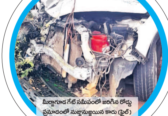
మీర్జాగూడ గేట్ సమీపంలో జరిగిన రోడ్డు ప్రమాదంలో నుజ్జునుజ్జులు కారు (ఫైల్)

అమ్మ జంక్షన్ నుంచి మన్నె గూడ వరకు ఉన్న హైదరాబాద్-బీజాపూర్ జాతీయ రహదారిలో మృత్యు ఘంటికలు మోగుతున్నాయి. రోడ్డు చిన్నగా ఉండి మూలమలుపులు అధికంగా ఉండడంతో వారంలో దాదాపుగా రెండు వరకు రోడ్డు ప్రమాదాలు జరిగి ప్రాణాలు గాలిలో కలిసిపోతున్నాయి. ఏడాదిన్నర క్రితమే టెండర్ల ప్రక్రియ పూర్తైనా.. రేవంత్ సర్కారు నిర్లక్ష్యంతో రోడ్డు విస్తరణ పనులు ముందుకు సాగకపోవడంతో ఆ దారిలో రాకపోకలు సాగించేందుకు వాహనదారులు జంకుతున్నారు.