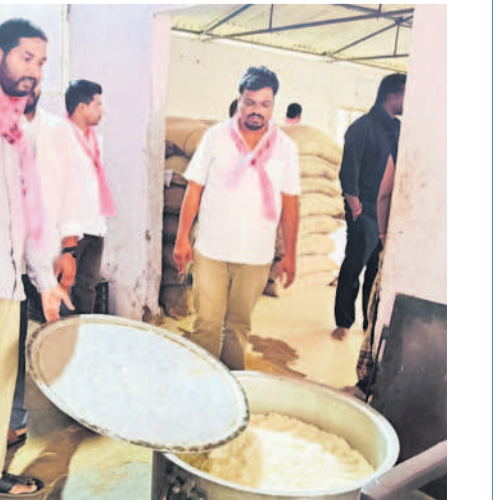
భోజనాన్ని పరిశీలిస్తున్న జిల్లాపట్టి నాయకులు