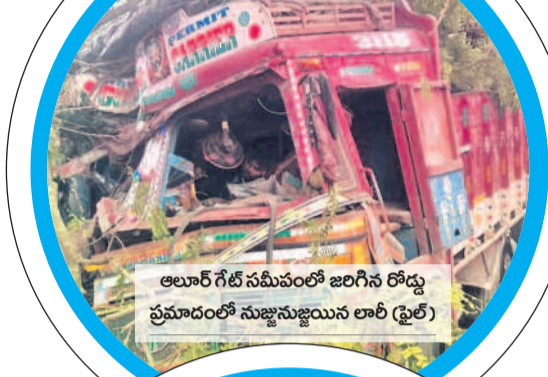
అలూర్ గేట్ సమీపంలో జరిగిన రోడ్డు ప్రమాదంలో నుజ్జునుజ్జులు లారీ (ఫైల్)

హైదరాబాద్-బీజాపూర్ జాతీయ రహదారిపై తరచూ రోడ్డు ప్రమాదాలు