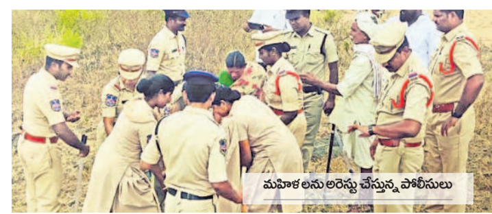
మహిళలను అరెస్టు చేస్తున్న పోలీసులు