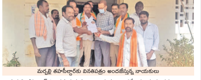
మర్చి తహసీల్దార్ కు వివరణ ఇవ్వడం అంబేద్కర్ హస్తం అమలు చేయాలి

మర్చి, డిసెంబర్ 3 : గత ప్రభుత్వం దశితుల అభ్యుత్థి కోసం తీసుకొచ్చిన అంబేద్కర్ హస్తం అమలు చేయాలని కలెక్టర్ అన్నారు. ఈ సందర్భంగా ప్రభుత్వం దశితుల అభ్యుత్థి కోసం తీసుకొచ్చిన అంబేద్కర్ హస్తం అమలు చేయాలని కలెక్టర్ అన్నారు. ఈ సందర్భంగా ప్రభుత్వం దశితుల అభ్యుత్థి కోసం తీసుకొచ్చిన అంబేద్కర్ హస్తం అమలు చేయాలని కలెక్టర్ అన్నారు.