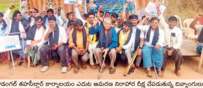
కొండగల్ తహసీల్దార్ కార్యాలయం ఎందుకు ఆమరణ నిరాహార దీక్ష చేపడుతున్న దివ్యాంగులు

బీహెచ్ఎస్ఎస్ అధ్యక్షులలో దివ్యాంగుల ఆమరణ నిరాహార దీక్ష