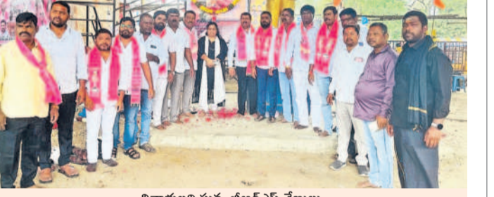
నివాళులర్పిస్తున్న బీఆర్ఎస్ శ్రేణులు