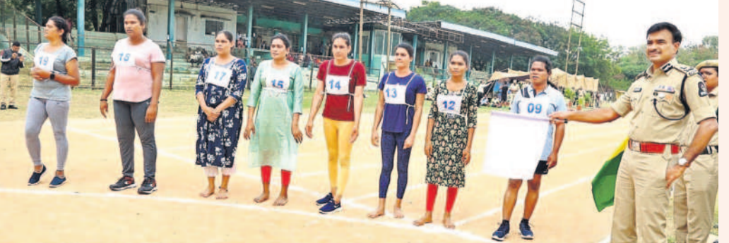
ట్రాన్స్ జెండర్లకు ఫిజికల్ ఈవెంట్ను ప్రారంభిస్తున్న నగర సీపీ ఆనంద్

సిటీబ్యూరో, డిసెంబర్ 4 (నమస్తే తెలంగాణ): పోలీసు శాఖలోని ట్రాఫిక్ విభాగంలో ట్రాన్స్ జెండర్ల భర్తీ ప్రక్రియ పురుషులైంది. ప్రభుత్వ ఆదేశాల మేరకు నగరంలో ట్రాఫిక్ క్లస్టర్ క్రమబద్ధీకరించేందుకు ట్రాఫిక్ అసిస్టెంట్లుగా ట్రాన్స్ జెండర్ల ఎంపిక ప్రక్రియను బుధవారం గోపాపూర్ లోని పోలీస్ స్టేషన్లో నగర పోలీసు కమిషనర్ సీ.పి. ఆనంద్ ప్రారంభించారు. సోషల్ వెల్ఫేర్ శాఖ ఇచ్చిన అభ్యర్థనల జాబితా ప్రకారం మొత్తం 58 మంది ట్రాన్స్ జెండర్లకు ఫిజికల్ ఈవెంట్ నిర్వహించగా, అందులో 44 మంది ఎంపికయ్యారు. సీ.పి. ఆనంద్ మాట్లాడుతూ మీ కమ్యూనిటీకి ఒక రోల్ మాడల్ కావాలంటూ.. ట్రాఫిక్ అసిస్టెంట్లుగా ఎంపికైన ట్రాన్స్ జెండర్లకు సూచించారు. సమావేశంలో ఒక రోజు ఇప్పటికే ప్రభుత్వం కల్పించిన ఈ సదాచరణాన్ని మినహాయించుకొని, పోలీసు శాఖకు మంచి పేరు తెచ్చాలన్నారు.