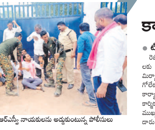
బీఆర్ఎస్ నాయకులను అడ్డుకుంటున్న పోలీసులు