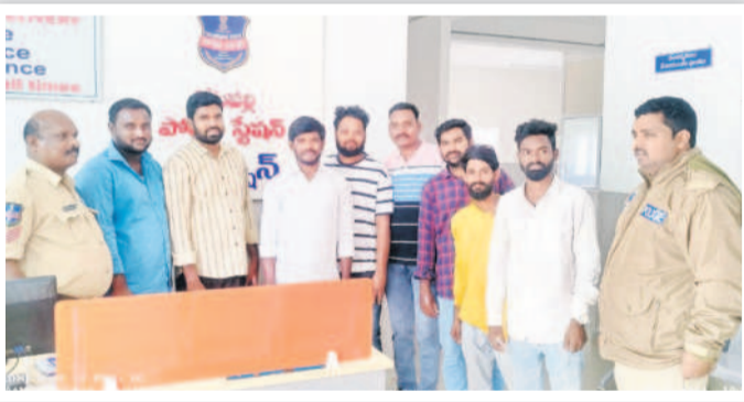
కోటపల్లి పోలీస్ స్టేషన్లో..