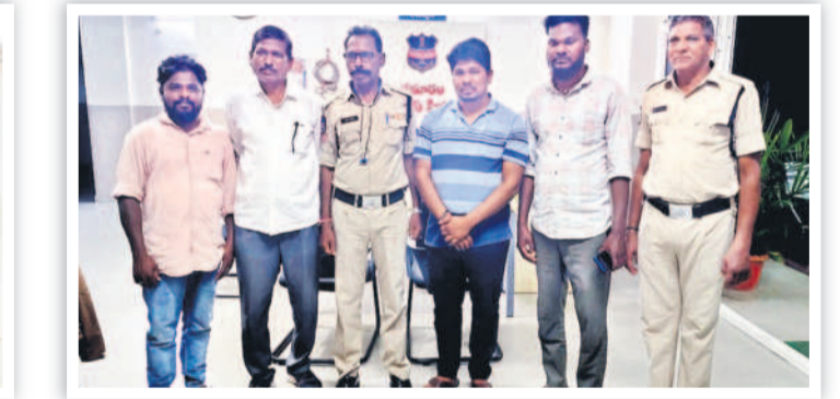
భీమారం పోలీస్ స్టేషన్లో..