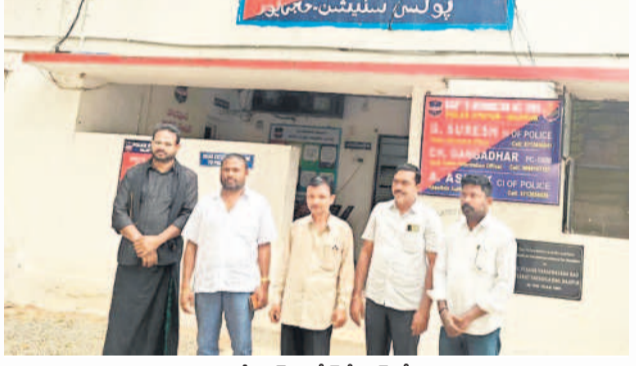
హాజీపూర్ పోలీస్ స్టేషన్లో..