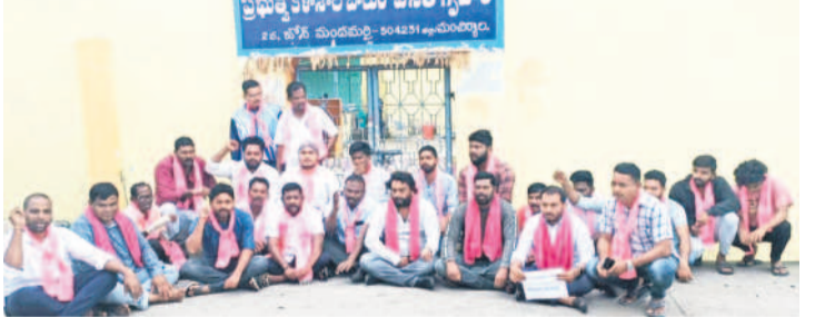
మండలం ఎస్సీ బాలుర వసతి గృహం గేటు ఎదుట ధర్మా చేస్తున్న బీఆర్ఎస్ నాయకులు