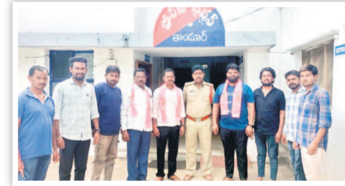
తాండూర్ : మాదారం పోలీస్ స్టేషన్లో..