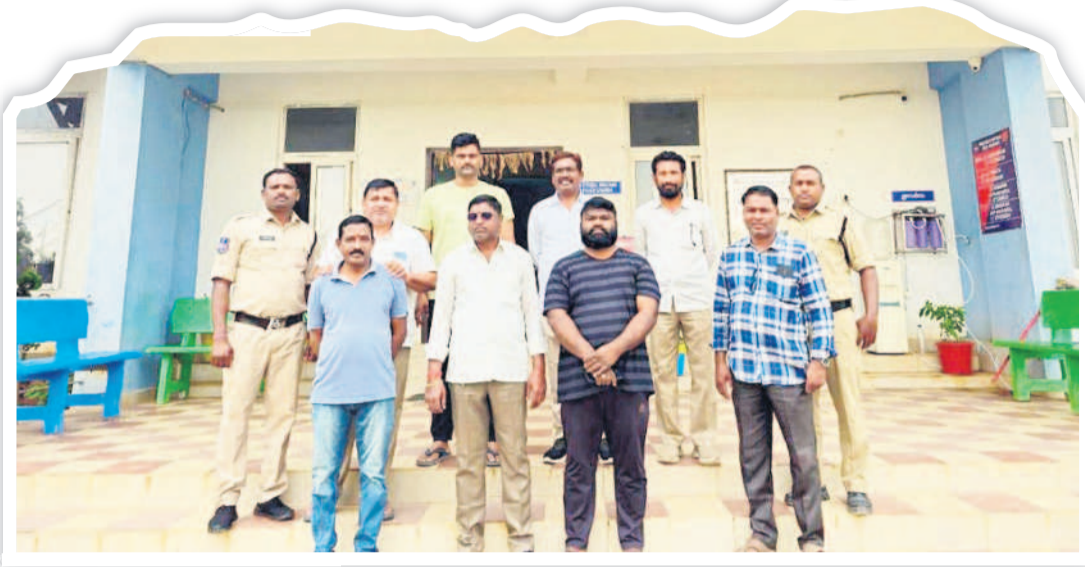
సీసీసీ నన్నూర్ : సీసీసీ నన్నూర్ పోలీస్ స్టేషన్లో అరెస్టయిన బీఆర్ఎస్ నాయకులు