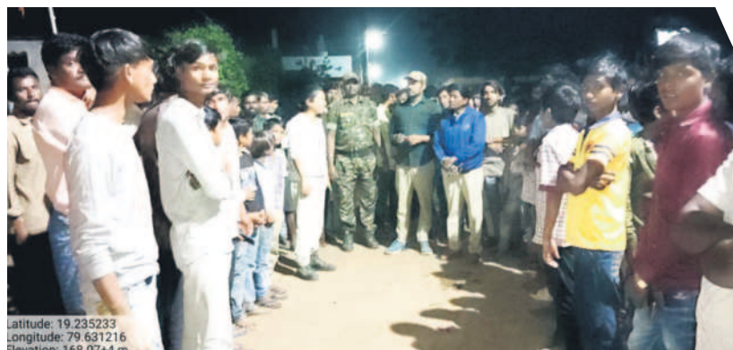
గ్రామస్థులకు అవగాహన కల్పిస్తున్న అటవీ అధికారులు