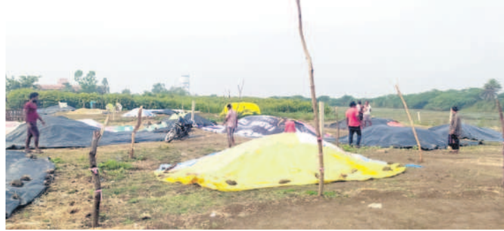
ధాన్యం కుప్పలపై కవర్లు కప్పడం రైతులు

నెన్నెల మండలంలో గురువారం కురిసిన అకాల వర్షానికి కల్లాల్లో ఉన్న ధాన్యంతో పాటు చేలల్లో ఉన్న పత్తి తడిసిపోయింది. నెన్నెల, గొల్లపల్లి, మైలారం, జోగిపూర్, ఘనపూర్, మన్నెగూడెం గ్రామాల్లో సన్న వడ్డు కల్లాల్లో పోయగా, ఒక్కసారిగా వర్షం వడదంతో తడిసిపోయింది. చాలీ చాలా కాలంగా ఏరని పత్తి వర్షానికి తడిసి ముద్దయ్యింది. పత్తి రంగు మారి ధర రాదని రైతులు ఆందోళన చెందుతున్నారు. - నెన్నెల, డిసెంబర్ 5