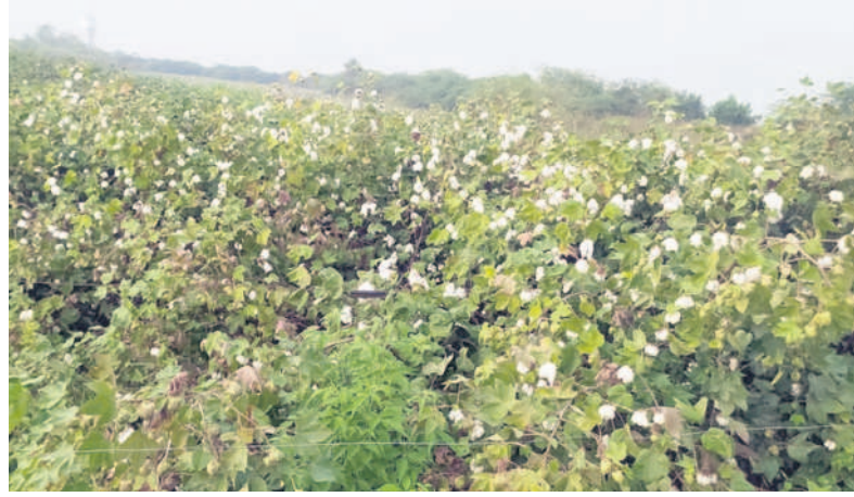
వర్షానికి తడిసిన పత్తి