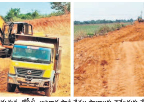
నల్లమల గట్టును కొట్టగొడుతున్న జేసీటీ, అధికార పార్టీ నేతల పాలలకు వెళ్లడంకు వేసుకుంటున్న మట్టి రోడ్డు

నాగర్ కర్నూల్ జిల్లా కొల్లాపూర్ మండలంలో అధికార ప్రోద్బలంతో అక్రమార్కులు నల్లమలలోని 6 గట్టును మాయం చేస్తున్నారు. సహజసిద్ధ అంధకారం నిలయంగా కొల్లాపూర్ నల్లమల గట్టును కొందరు బోడిగండు కొట్టి అంద వికారంగా చేస్తున్నారు. పర్యావరణం తోపాటు వేలాది చెట్లను నరికి వెళ్తున్నారు. ఎర్రమట్టి కోసం జరుగుతున్న ఈ తతంగం అధికారుల కండ్లముందు జరుగజేస్తున్న ప్రజాపత్రిని డూ అందండలు ఉండడంతో ముడు పలు తీసుకొని పట్టిపట్టినట్లు వ్యవహారిస్తున్నారన్న ఆరోపణలు వినిపిస్తున్నాయి. కొల్లా పూర్ నుంచి పర్యటించే ప్రదేశ త్రో సోమశిల, కృష్ణానది తీరానికి వెళ్లే ప్రధాన రహదారికి రెండు వైపులా ఉన్న గట్టును పట్టుకోవడానికి గొప్ప గొప్ప ప్రజాపత్రిని డూ అధికారి అటు వైపు కన్నెత్తి చూడడం లేదన్న ఆరోపణలు వినిపిస్తున్నాయి. కొల్లాపూర్లో మట్టి మాఫియా చేసే అరాచకం ఇందుకు అడ్డం పడుతోంది. ప్లావే కోసం సర్దే నెంబర్ 69, 70, 71లో నాలుగుసార్లు ఎక్కాలో 20 వేల క్యూబిక్ మీటర్ల మట్టి తీసేందుకు రూ.10 లక్షలు చలానా, గట్టుపై ఉన్న విలువైన చెట్లను పంట చెరుకుగా చూచి రూ.10 వేల చలానా కట్టారు. అయితే అక్టోబర్ రెండో వారంలో గట్టును తవ్వడం ప్రారంభించి ఇప్పటివరకు కేవలం వెయ్యి టిప్పురైజ్ మాత్రమే మట్టి తీసినట్లు గుర్తేదారులు చెబుతున్నారు. కానీ.. ఇప్పటికే దాదాపు పది ఏకైక మింది 30 క్యూబిక్ మీటర్లలో మట్టి తరలివేస్తున్నట్లు తెలుస్తోంది. ఇది అదునుగా ప్లావే పేరిట మట్టిని తరలిస్తూ అధికార పార్టీ నేతలు కొందరు వారి పాలేలూ రోడ్డు వేసుకుంటున్నారని సమాచారం. పోలీస్, రెవెన్యూ విభాగంలో ఉన్న ఏరి యల్ బహిరంగంగా గట్టును తవ్వకున్నట్లు చెబుతున్న డిఈవో, అధికార పార్టీ నేతల పాలలకు వెళ్లడంకు వేసుకుంటున్న మట్టి రోడ్డు