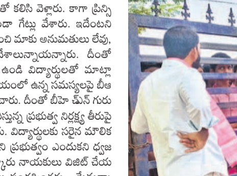
గేట్ బయట నిలబడి విద్యార్థులతో మాట్లాడుతున్న బీఆర్ఎస్ నాయకులు