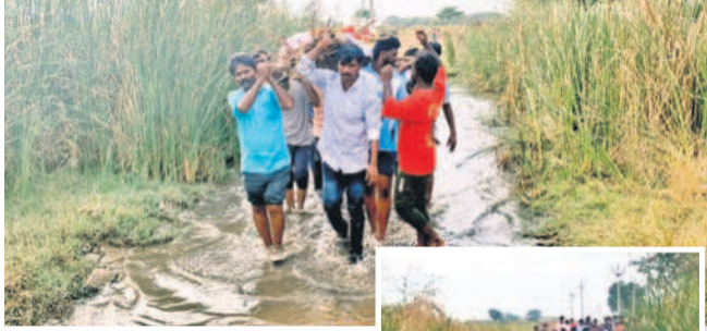
మంగళవారం వంపులో పాడుతున్న నీటిలో నుంచి పాడైన తీసుకొచ్చిన దుశ్శం, నీటిని దాటుతున్న మహిళలు

నీటిలోనే పాడైన మోసుకెళ్తున్న ప్రజలు కలర్లు నిర్మించాలని ప్రజలు, రైతుల వేడు కోలు మరకల్, డిసెంబర్ 5 : నారాయణపేట జిల్లా మరకల్ మండలకేంద్రంలో చివరి మజిలీకి ఇక్కట్లు తప్పడం లేదు. మరకల్ మండల కేంద్రంలోని నారాయణపేట శుశానవాటిక వద్దకు మృత దోహాన్ని పూర్తిగా తీసుకొచ్చిన నాచునం చేయాలింది. మరకల్ నుంచి పెద్దపల్లి నుంచి నారాయణపేట వరకు వద్దకు వెళ్లే మంగ