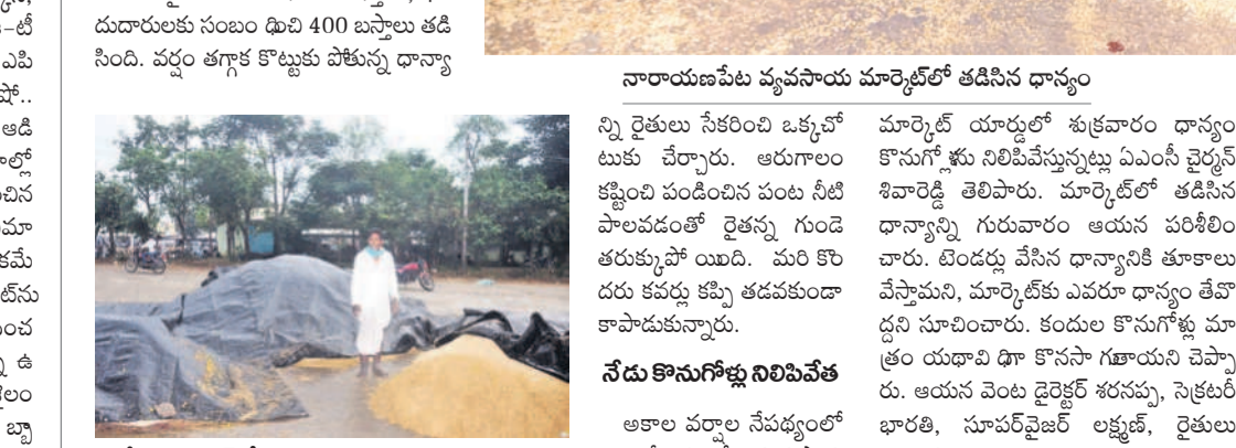
పేట మార్కెట్లో తడిసిన ధాన్యం చూపిస్తున్న రైతు

పేట మార్కెట్లో తడి నీవ్ 420 బస్తాల ధాన్యం నారాయణపేట టౌన్, డిసెంబర్ 5 : అకాల వర్షానికి మార్కెట్లోని ధాన్యం తడి వింది. గురువారం నారాయణపేట జిల్లా కేంద్రంలోని వ్యవసాయ మార్కెట్ మొత్తం 4,331 బస్తాల ధాన్యాన్ని విక్రయించేందుకు సమీప గ్రామాలకు చెందిన రైతులు తీసుకొచ్చారు. అయితే మధ్యాహ్నం ఒక్కసారిగా వాన రావడంతో కర్షకులు బార్నాలిన్ కవర్లు ధాన్యంపై కప్పేయగా చాలా వరకు తడిసిపోయింది. రైతులకు చెందిన 20 బస్తాలు, ఖరీదుదారులకు సంబంధించి 400 బస్తాలు తడిసింది. వర్షం తగ్గాక కొట్టుకు పోతున్న ధాన్యం