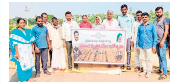
ఆత్మకూరు : పెంచికల్ పేటలో రైతులకు సేంద్రియ సాగు పై అవగాహన కల్పిస్తున్న ఏవో శ్రీనివాస్